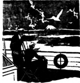
大戰中國際新聞界之動態