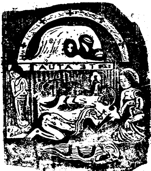
作 夏 高 (法) 地 畫