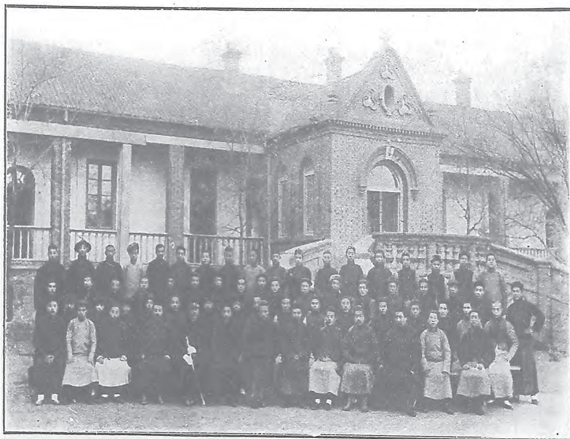
中華民國三年天津私立單級師範講習所攝影