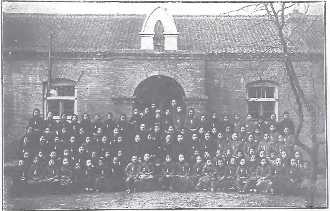
影合 校學小女等高淑貞一第立私 津天年三國民華中 校學小女等初愛仁立私