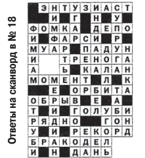
Ответы на сканворд в № 18