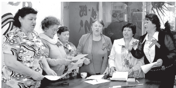
Команда «Катюша»: третье место - тоже «призовое»!

Большинство участников «Майского десанта» были одеты в форму - в стиле красноармейцев военных лет. Наверняка такие фотографии станут украшением семейных альбомов