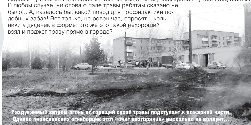
Раздуваемый ветром огонь от горящей сухой травы подступает к пожарной части. Однако переславских огнеборцев этот «очаг возгорания» нисколько не волнует...

Пикантность ситуации в том, что аккурат в это время сюда были приглашены учащиеся школ города - на открытый урок по ОБЖ (см. предыдущий номер). Вот они - у ворот части слушают рассказы пожарных. Странно, но полыхающий совсем рядом огонь тех совершенно не отвлекает. Почему-то уверен, что и подпалили траву сами пожарные - уж больно спокойно относятся они к «очагу возгорания» у себя под носом... В любом случае, ни слова о пале травы ребятам сказано не было... А, казалось бы, какой повод для профилактики подобных забав! Вот только, не ровен час, спросят школьники у дяденек в форме: кто же это такой нехороший взял и поджег траву прямо в городе?