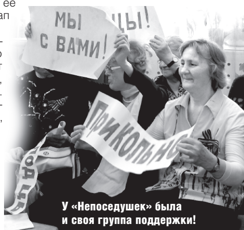
У «Непоседушек» была и своя группа поддержки!

Отрадно было увидеть, что молодежь неплохо знает песни военных лет и классику отечественного кинематографа. Но все же удача в тот день была на стороне дружной команды «Непоседушки», победившей с большим отрывом. А закончилось все совместным дружеским чаепитием.