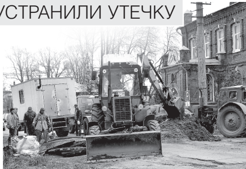
Идет устранение утечки на водопроводе, из-за которой затопливали подвал здания