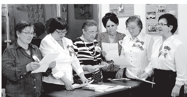
С большим отрывом победили «Непоседушки»