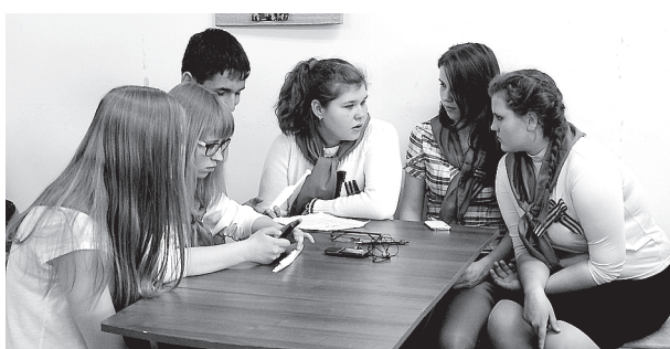
«Дети пионеров» - волонтеры из молодежного центра