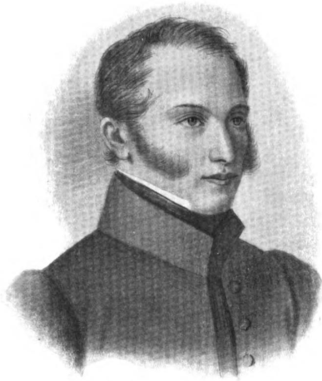
БАРОНЪ АНДРЕЙ ЕВГЕНІЕВИЧЪ РОЗЕНЪ.