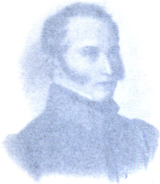
УНАЧТО ФЕДОРОВИЧЪ 1851 г. в. 1.