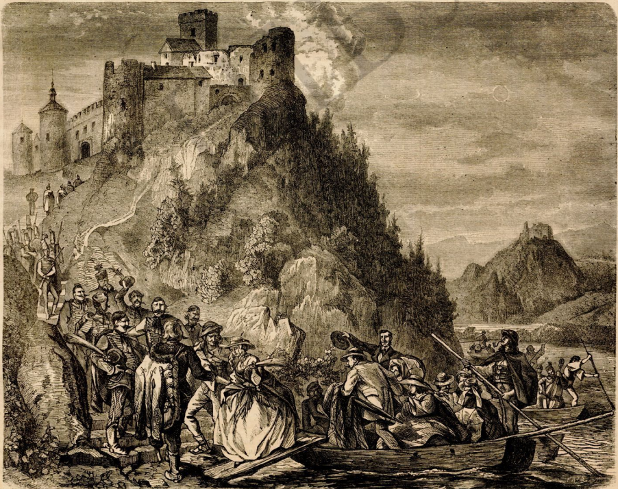
Переводъ изъ Пенджабы въ Чорхатынъ (см. стр. 217).

Теперь можно было ожидать, что практически образованный лингвистъ, который уже въ Англіи успѣлъ создать цѣлый рядъ полезныхъ питомцевъ, развить свою систему еще болѣе въ Индіи. Это ожиданіе вполне оправдалось составленіемъ новаго учебнаго плана, вполне соответствующаго потребностямъ оспидскаго народа,