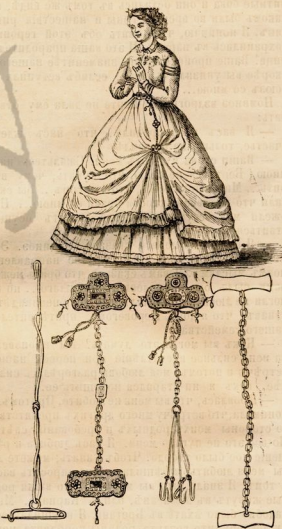
Новыя тиретки для платьевъ.

Между тѣмъ, и Тьеръ старался отвратить предстоящую катастрофу составленіемъ своего мнѣ-