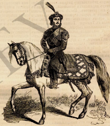
Раджа на конѣ.

вше число войскъ. Въ это самое время приближалъ къ Фовель, богатый парижанин, знакомый съ Бюжо, и громко сказалъ ему: