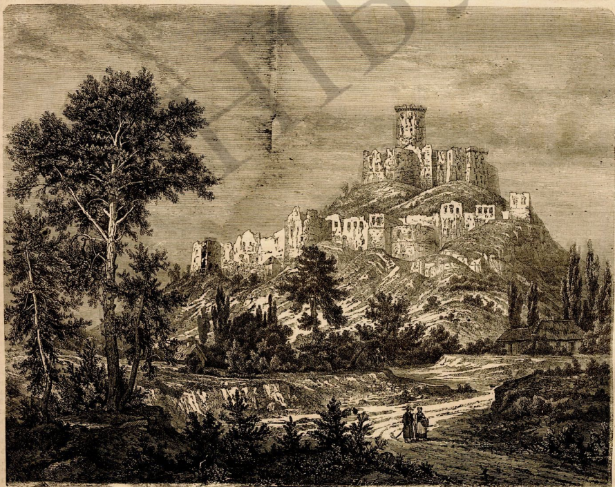
Развалины замка Пилли.