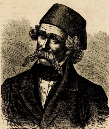
Вукъ Стефановичъ Караджичъ.

Восставіе въ мѣстности, гдѣ жилъ Вукъ, какъ и въ другихъ мѣстахъ Сербіи, сначала обшало успѣхъ; но вскорѣ нахлынувшая изъ Босніи многочисленная армія, превращавшая численностью востаншихъ, совершенно подавила революцію. Родное нещастіе Вука было предано пламени, и ему самому пришлось искать убѣжища и спасенія у единоземцевъ-турковъ, находившихся въ мѣстности Австріи. Здѣсь, нѣсколько времени своего изгнанія онъ употребилъ на свое образованіе, и для этого отправился въ резиденцію сербскаго патріарха въ Карловинѣ, гдѣ семинарія обшала удовлетворить его жаждѣ къ познанію. Къ несчастью, оказалось, что двенадцатилѣтній юноша не былъ даже на столько подготовленъ, чтобы поступить хотя въ первый