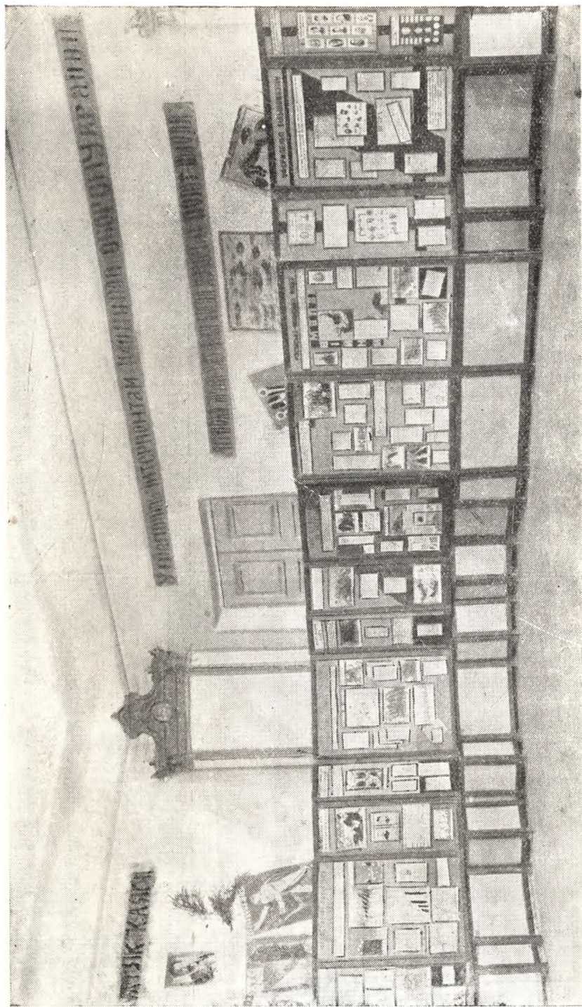
ВИСТАВКА „1905 Р.“ М. МОГИЛІВ НА ПОДІЛЛІ — ПРИМІЩЕННЯ ПЕДТЕХНІКУМУ