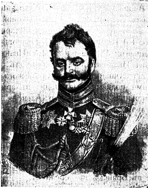
Графъ Василій Васильевичъ Орловъ-Денисовъ.