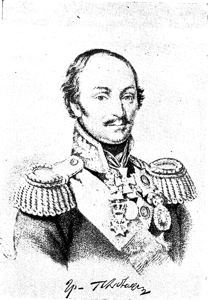
Графъ Матвѣй Ивановичъ Платовъ.