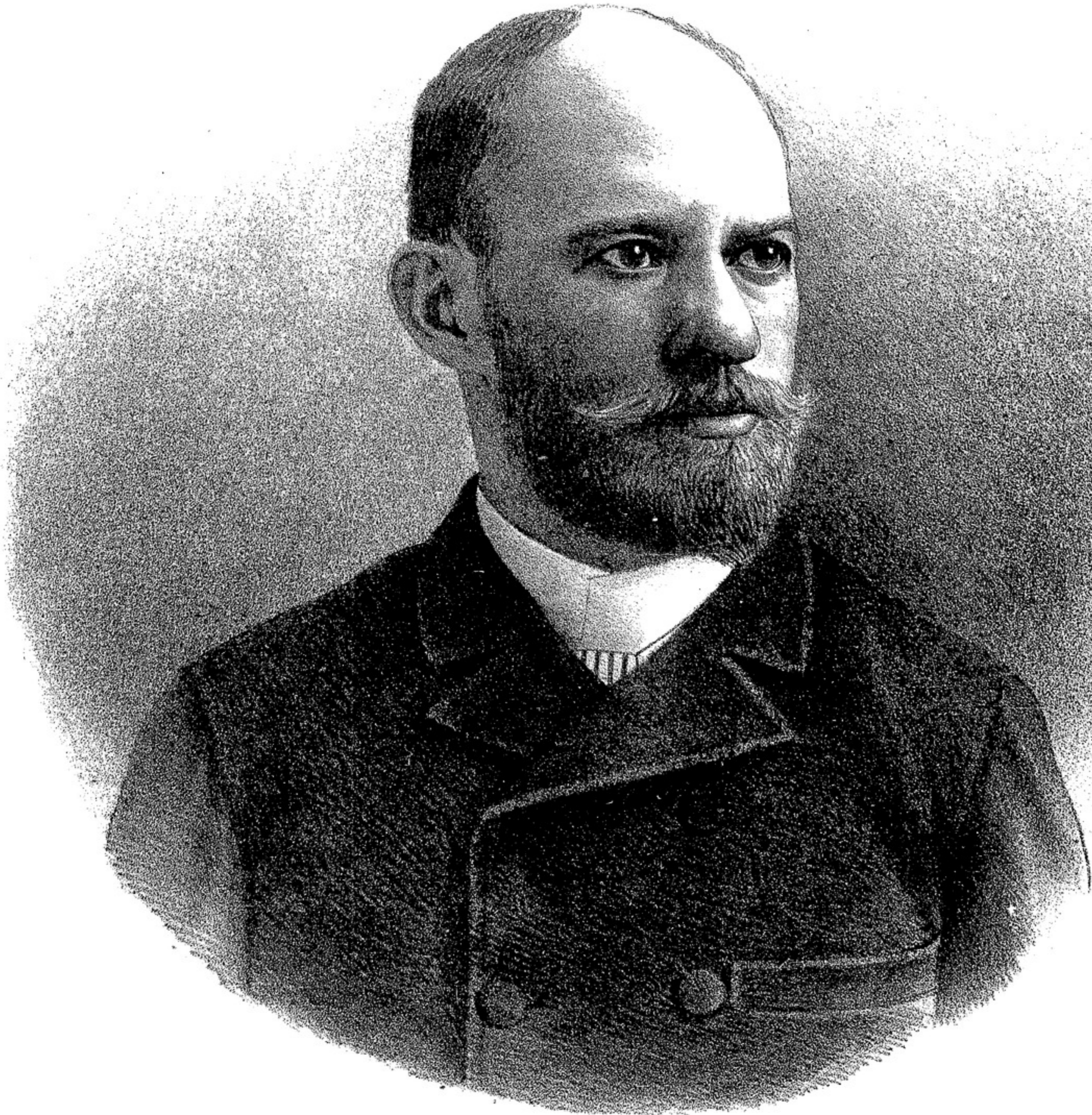
SEÑOR DON JULIO POPPER

INGENIERO Y EXPLORADOR DE LA TIERRA DEL FUEGO