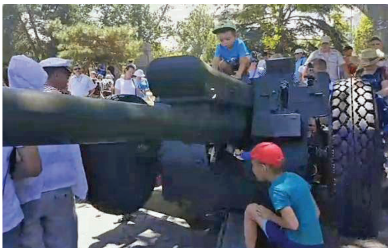
Святкування дня військово-морського флоту РФ у Севастополі. 30.07.2017 р.

НА ДОДАЧУ «З МЕТОЮ ПАТРІОТИЧНОГО ВИХОВАННЯ» «УПРАВЛІННЯ» РОЗРОБИЛО І ЗАРЕЄСТРУВАЛО ТУРИСТИЧНИЙ МАРШРУТ «КРИМСЬКА ВЕСНА», ПРИСВЯЧЕНИЙ ПОДІЯМ ОКУПАЦІЇ КРИМУ РОСІЙСЬКИМИ ВІЙСЬКОВИМИ У ЛЮТОМУ-БЕРЕЗНІ 2014 Р. ПІШИЙ МАРШРУТ, РОЗРАХОВАНИЙ НА ТРИ ГОДИНИ, ПРОХОДИТЬ КЛЮЧОВИМИ МІСЦЯМИ, ПОВ'ЯЗАНИМИ ЗІ «ВХОДЖЕННЯМ КРИМУ ДО СКЛАДУ РФ»: ЦЕ «ДЕРЖАВНА РАДА РЕСПУБЛІКИ КРИМ» (ЗАХОПЛЕНА БУДІВЛЯ ВЕРХОВНОЇ РАДИ АР КРИМ), ПАМ'ЯТНИКИ «ВВІЧЛИВИМ ЛЮДЯМ» І «ОПОЛЧЕННЮ ВСІХ ЧАСІВ», ПАМ'ЯТНИЙ ЗНАК «НАШ ДІМ – РОСІЯ» ТОЩО.