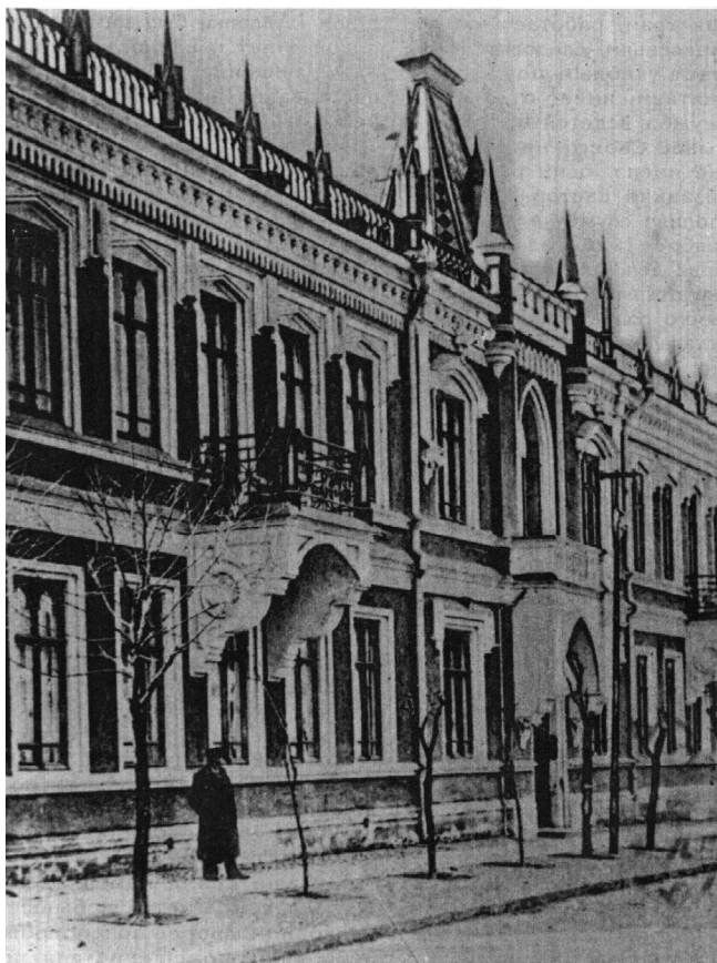
А ще раніше тут було училище при лютеранській церкві

1 вересня широко відчинить свої двері для гостей і школярів перша в Криму українська школа-гімназія. Довгі роки плекала мрію про неї свідома українська інтелігенція Криму, тяжко за неї боролася. І ось мрія стала дійсністю. Цю дату по праву можна вважати історичною не тільки для освітньої галузі, а й для розбудови нашої Української держави.