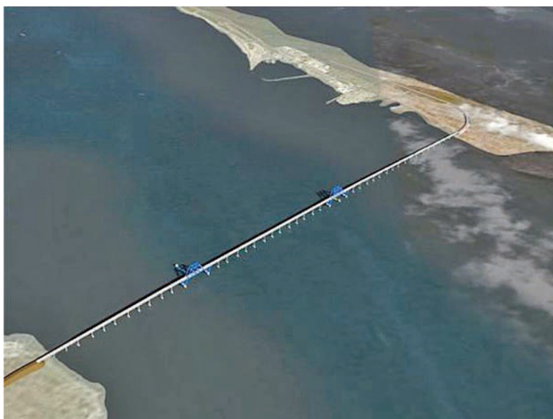
Проект будівництва мосту 2010 року

не в змозі взяти на себе навіть половину необхідних витрат. У свою чергу, російська сторона нарікала на відсутність технічного обґрунтування.