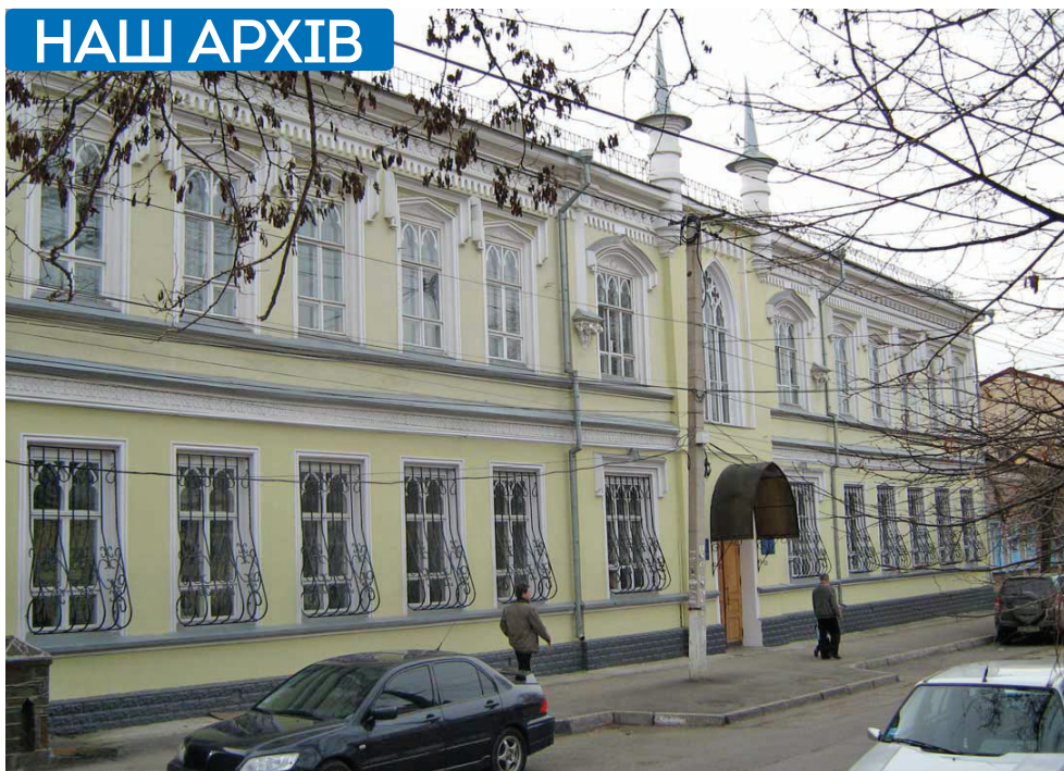
У цьому приміщенні в 1997 році розташовувалась Українська гімназія, згодом – Головне управління юстиції