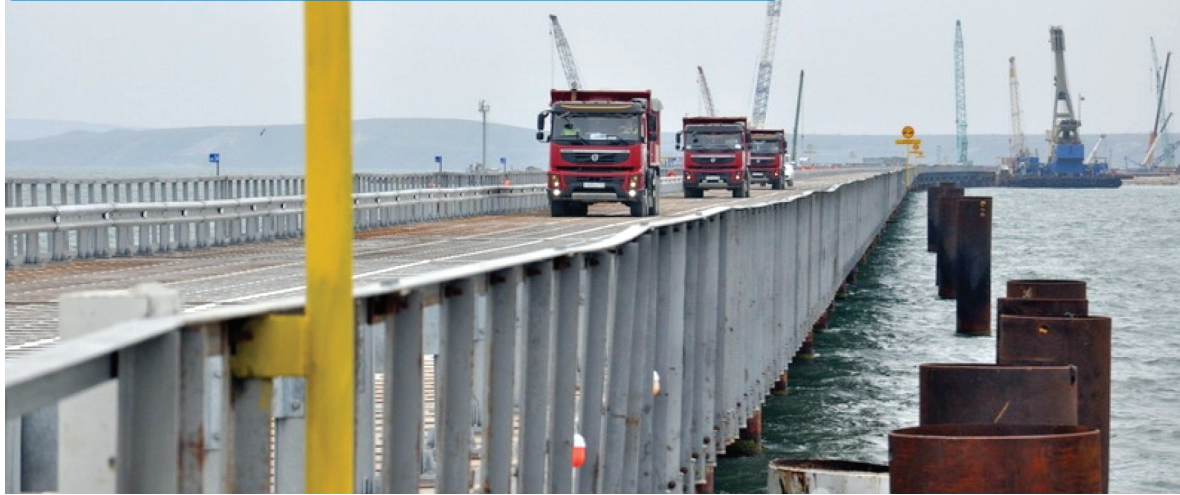
Будівництво Кримського мосту, 2016 рік