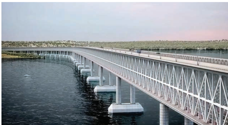
Проект 2014 року