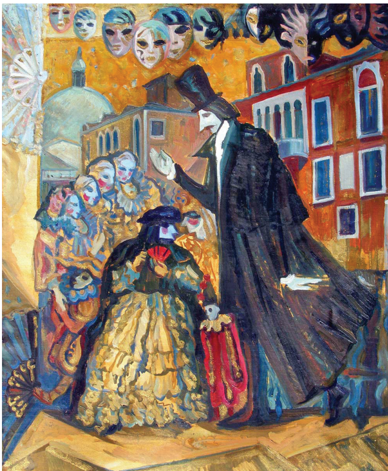
І. Левитська «М. Гоголь у Венеції», 1996 р., полотно, олія

Київ, Лиман, Чорне море, Крим і Карпати, земля за Карпатами – це той світ, у якому існував Гоголь. Він з точністю окреслив межі України, на його мапі нема Сибіру, Кремля чи навіть Білорусії, але є і Крим, і болотяний Сиваш, є Карпати. Микола Васильович, безумовно, належав цій землі, і жодній іншій, та писав він російською мовою, і жодною іншою... То російський він письменник чи український?