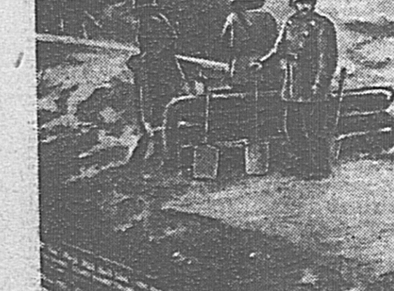
На одной из улиц Берлина после бомбардировки.

Расстояние не защищает и более отдаленные центры Германии от ударов английских воздушных сил. Растущий британский флот мощных бомбардировщиков дальнего действия — английских «Уитли» и «Валхантонов», американских «супертяжелых», — несомненно, будет со временем наносить все более чувствительные удары германским жизненным центрам.