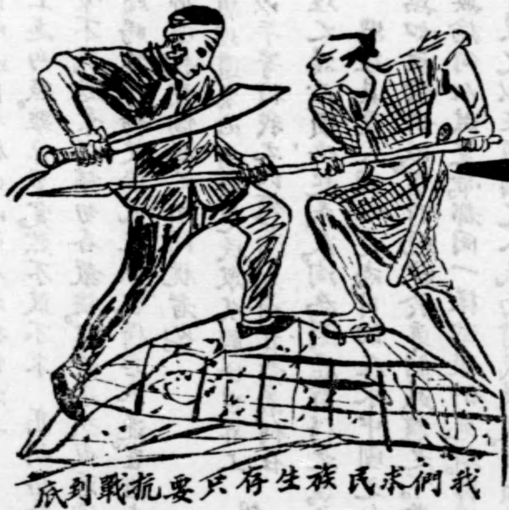
我們民族生存要抗戰到底

麼差誤過失，或言行不一，或有不誠不實，不能盡忠職守之時，務望諸位不吝教益，隨時糾正，以期毋負斯職。中正只憑着這一片為國為民之愚忠，與赤忱，願與各位患難與同，榮辱與共，一心一德，貫徹始終，以盡我們對抗戰建國所負的使命，以答政府和全國同胞的期望。