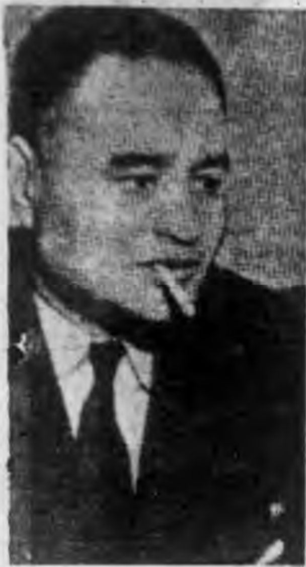
貝那多特被 刺項命後， 任代理聯合 國巴勒斯坦 調解專員的 彭契 (Dr. Ralph Jo- hanson Bu- nehe)。他 是黑奴籍的 美國教授， 現正以大無 畏的精神出