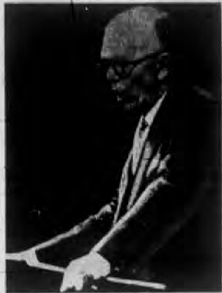
馬歇爾 在聯合 國大會 中演說 美國基 本外交 政策。