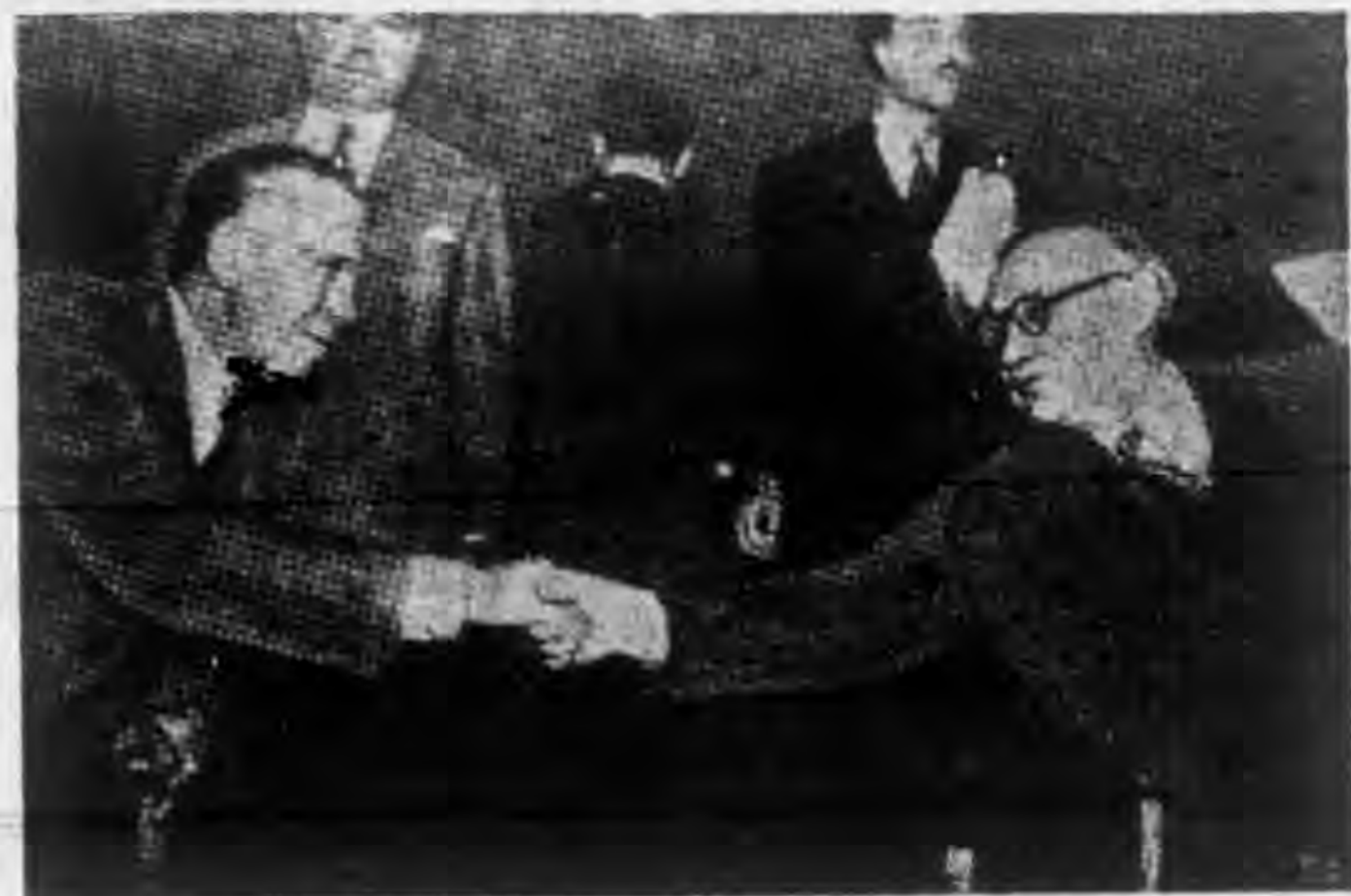
英國外 相貝文 (右)在 大會中 作了關 於原子 彈的演 說後， 馬歇爾 與之隔 座握手 言歡。