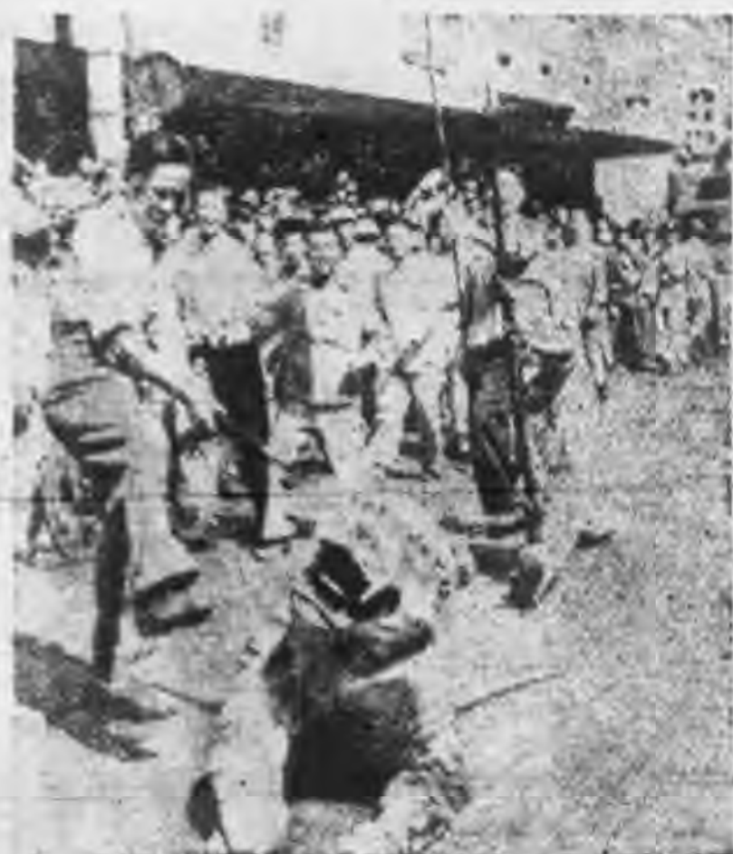
雙十節 上海市 民遊行 時，曾 有精彩 的化裝 表演節 目。圖 中「一 打虎」 的一幕