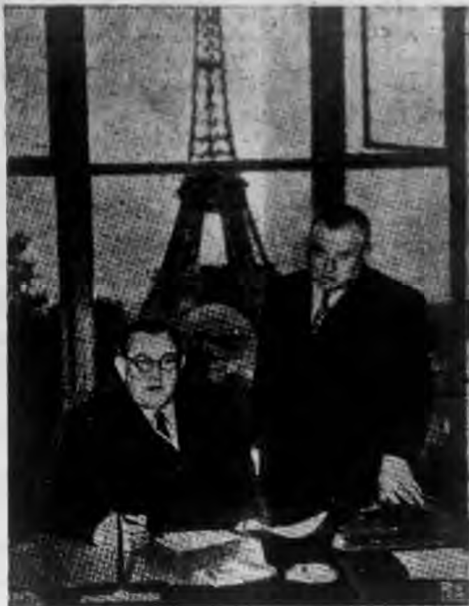
聯合國秘書 長賴伊(左) 在巴黎夏樂 宮中他的辦 公室內坐着 談話。旁立 者(右)為副 秘書長柯台 爾 (Andrew Cordier)。 從窗中可以 望見厄斐爾 塔。