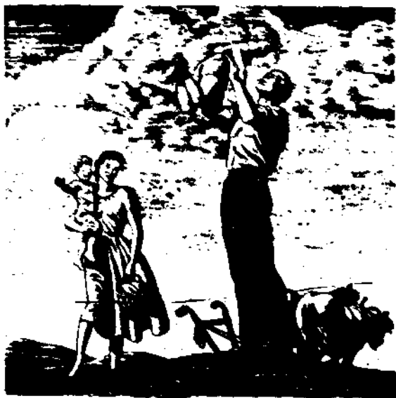
苦累日在累，有時白雲起，天際自舒卷，人面得所慰。

「時乎，時乎，不再來」，任其不可復追，只好聽它去罷；把中國建設成一個民權和民生，政治民主與經濟民主並重的新國家，可能性還是絕對有的。但過需要我們努力去爭取。