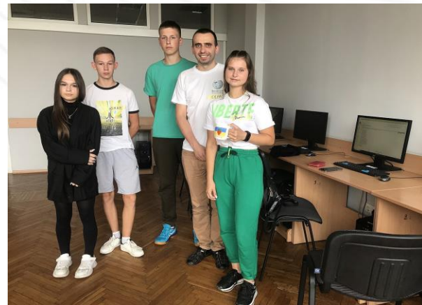
MarianaSenkiv, CC BY-SA 4.0