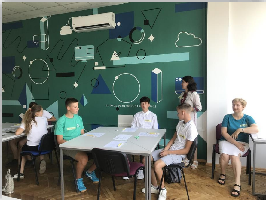
MarianaSenkiv, CC BY-SA 4.0

Як: презентації, практичні завдання, вікторини, kahoots, конкурси