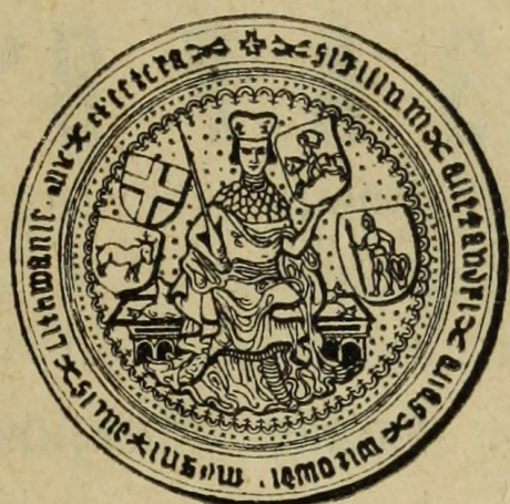
Печать Витовта, вел. кн. Литовскаго.