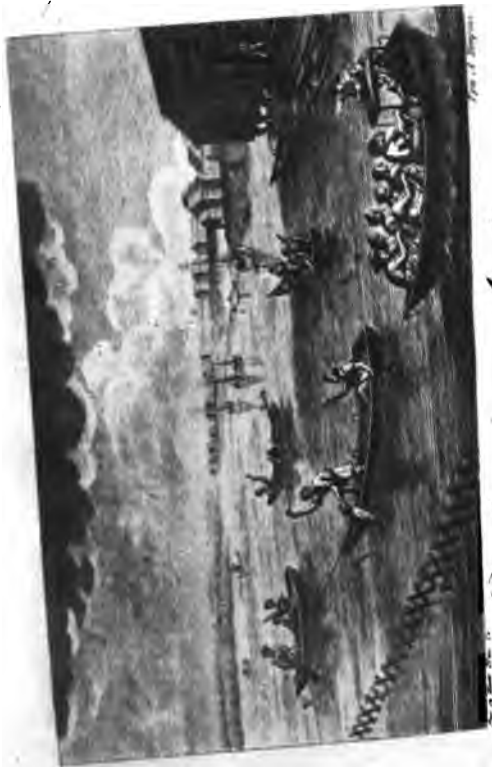
Родина моего отца. Амстердам.