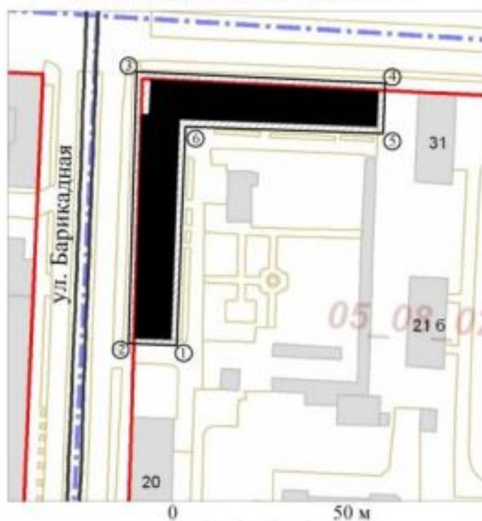
СХЕМА ГРАНИЦ ТЕРРИТОРИИ ОБЪЕКТА КУЛЬТУРНОГО НАСЛЕДИЯ РЕГИОНАЛЬНОГО ЗНАЧЕНИЯ «ДОМ ЖИЛОЙ», 1930-е гг., РАСПОЛОЖЕННОГО ПО АДРЕСУ: г. ВОЛГОГРАД, ул. БАРРИКАДНАЯ, 22, ул. СОЦИАЛИСТИЧЕСКАЯ, 33