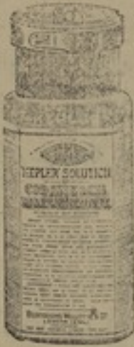
شكله مصغر جداً

محلول ، كپلار ، ذو طعم شهى كاجود انواع العسل