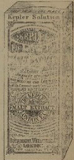
شكله مصغر جداً

محلول ، كپلار ، يحسن مزجه بالارز واللبن وكثير من الوان الطعام فيصيرها لذينة الطعم مغذية منعشة يمكن الحصول على محلول ، كپلار ، من جميع الاجز اخانات اوكلا، اسطيفان لتج وشركاه