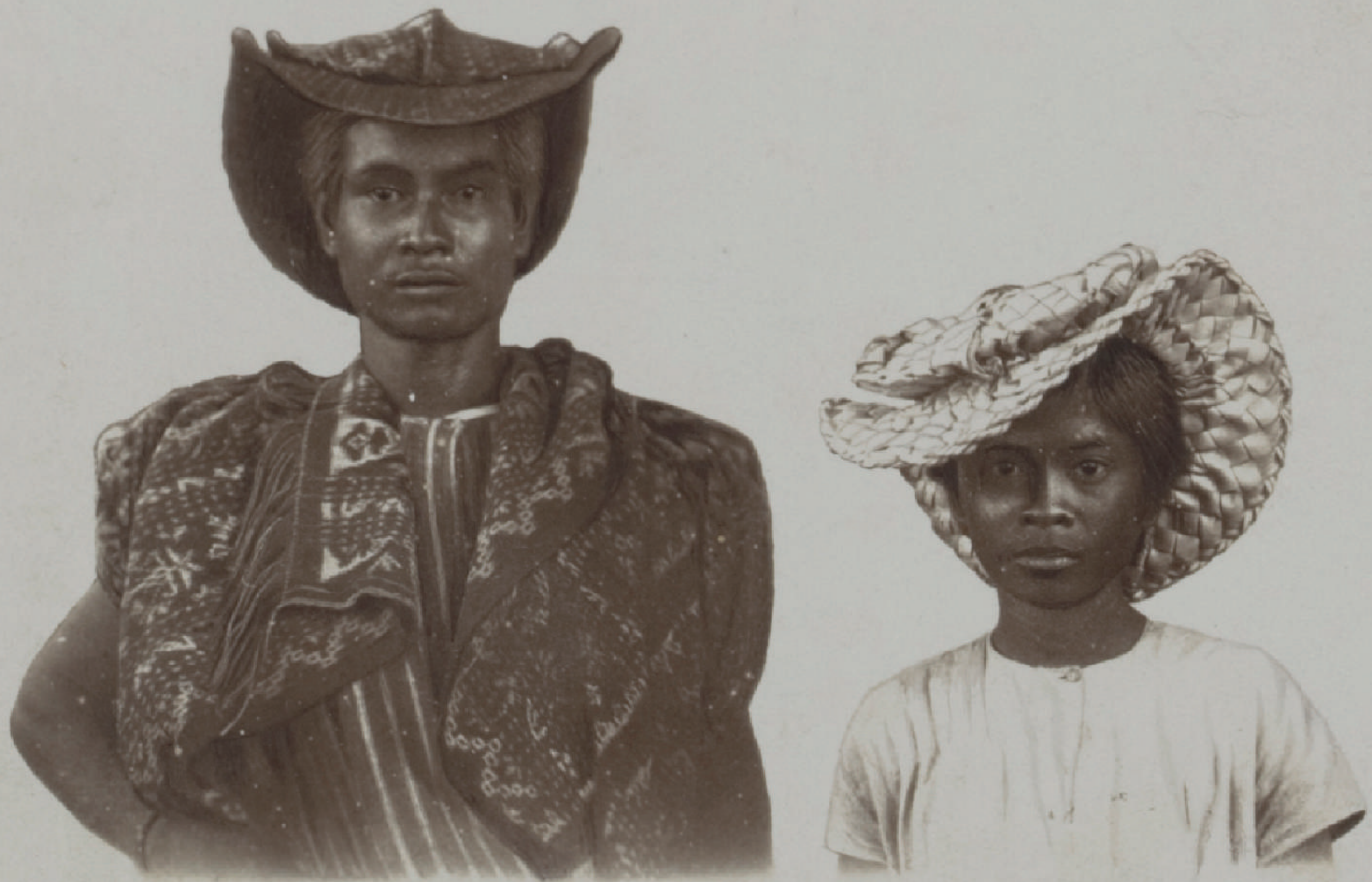
Dua Penduduk Rote Mengenakan Topi Khas Dari Karet (Sekitar 1899)