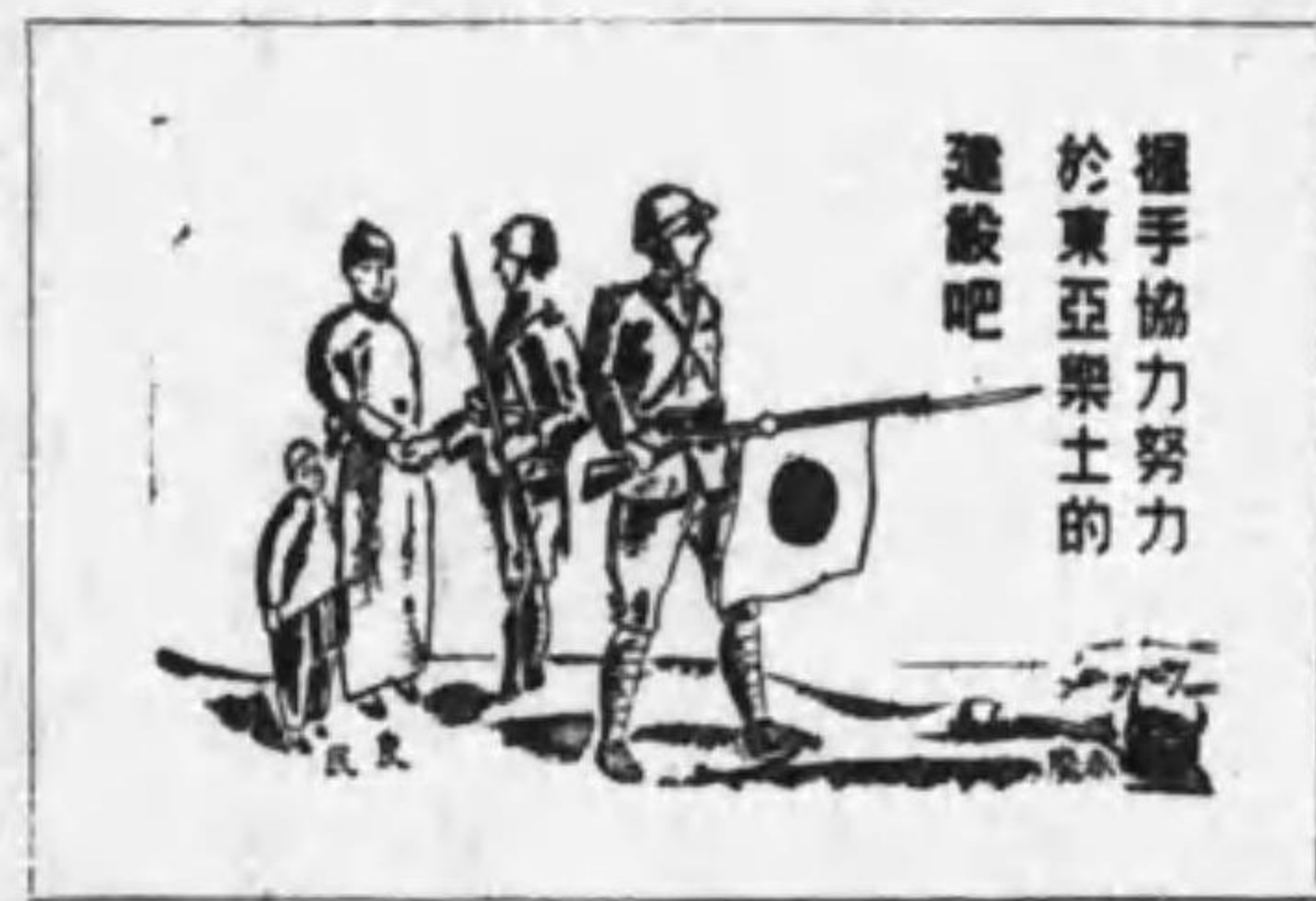
握手協力努力於東亞樂土的建設吧

架 照例 台 照例ノ如ク 所剩餘ノ所 傳單ノ 宣傳ピラ 街鎮 縣內百戸 以上ノ街 市ヲ鎮ト 爲ス 蒞臨ソリン 到來スル