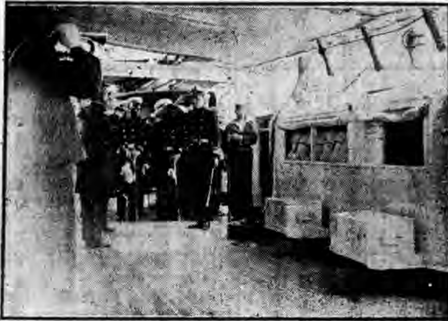
禮敬之時艦到容海閱校長員委陳

宣傳要點：一、述肇和戰役之意義 二、闡揚肇和戰役之精神 三、說明肇和戰役之影響。