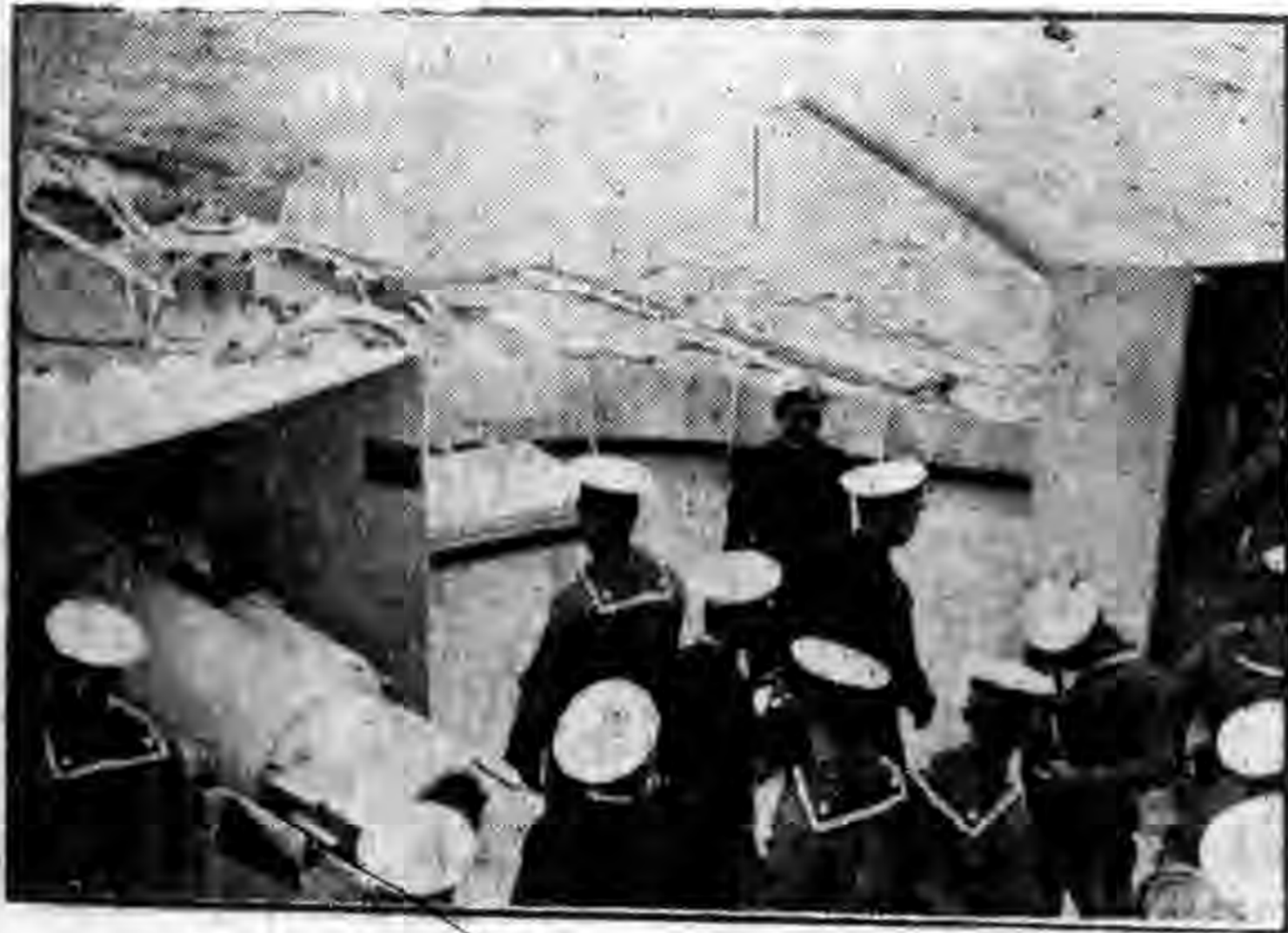
砲首艦容海閱檢長員委陳

中抵力汽缸并軸枕銅套。 克安運艦，三日上午十時由馬江開行，五日上午十時五十分抵澎湖，正午十二時半開行，下午二時十分抵高昌廟。 崇甯砲艇，二日下午二時十五分抵馬江，八日上午十時四十分開行，下午五時寄錨溫嶼門，九日上午十時開行，十一時半抵平潭。