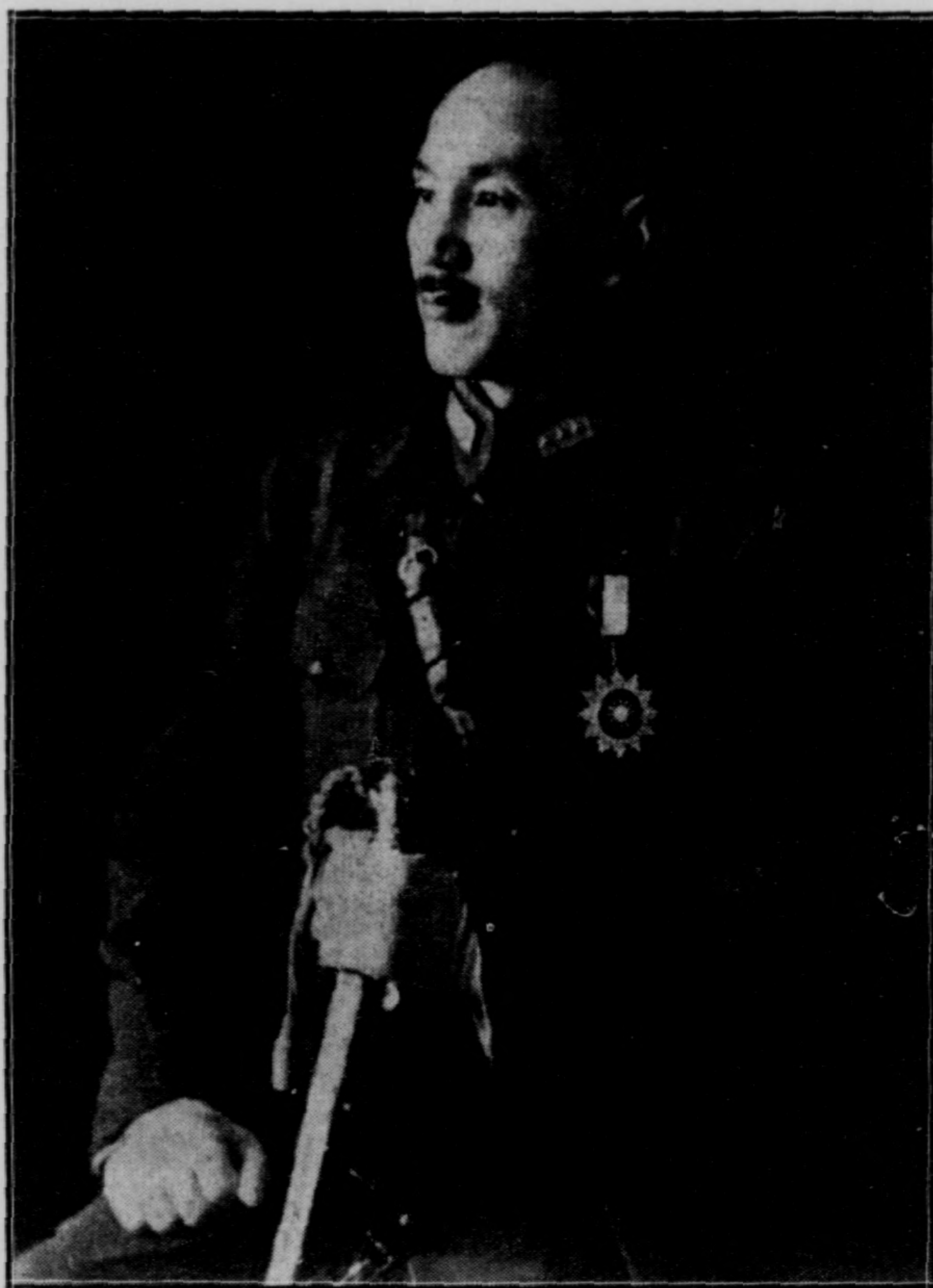
石 介 蔣 長 員 委 事 軍