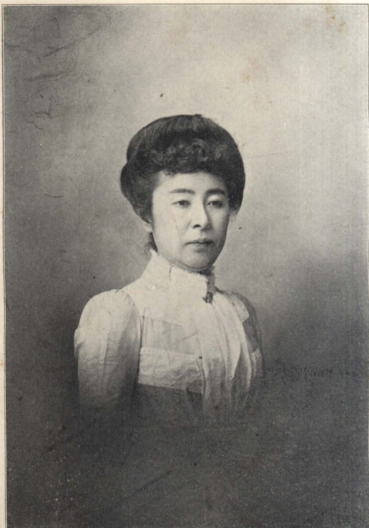
監學校學女族華 掛用御宮常 史女子歌田下位四從