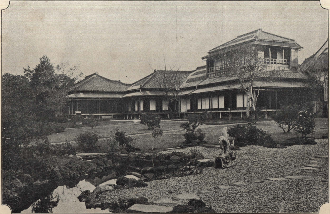
圖 之 園 花 苑 舍