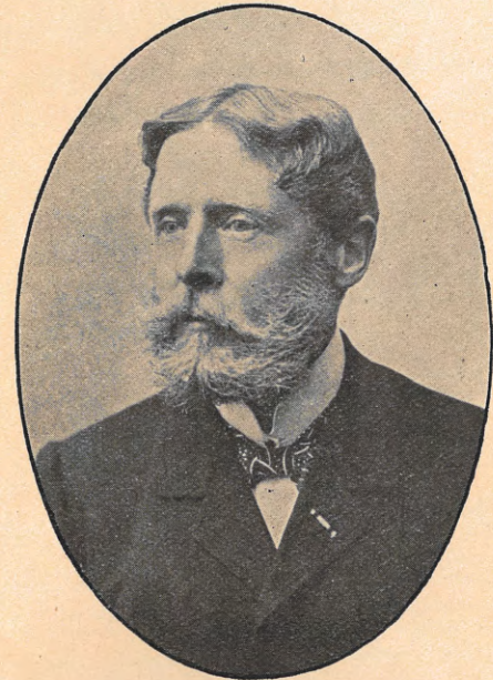
Mr. J. C. DE MAREZ OYENS.

Met 1 Augustus 1901 trad hij op als minister van Buitenlandsche Zaken.