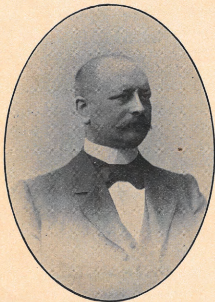
Mr. J. A. LOEFF. Minister van Justitie,

Dr. KUYPER is de schrijver van Ons Program , het boek waarin de beginselen der anti-revolutionaire partij zijn uiteengezet en toegelicht, waarvan de eerste druk in 1879 verscheen en dat in 1880 werd herdrukt.