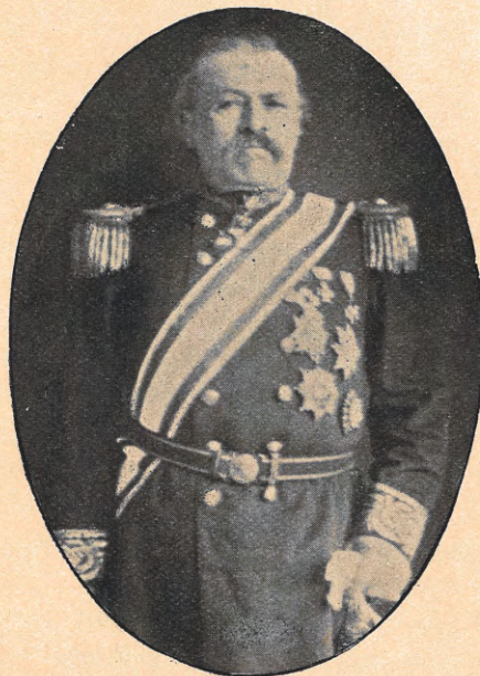
Vice-Admiraal G. KRUIJS. Minister van Marine.

Van de door den heer HARTE uitgegeven geschriften verdienen bijzondere vermelding: De Rentestand (door de rechtsgeleerde faculteit der Utrechtsche hoogeschool bekroond met de gouden eerepenning) en Vrijhandel en Bescherming .