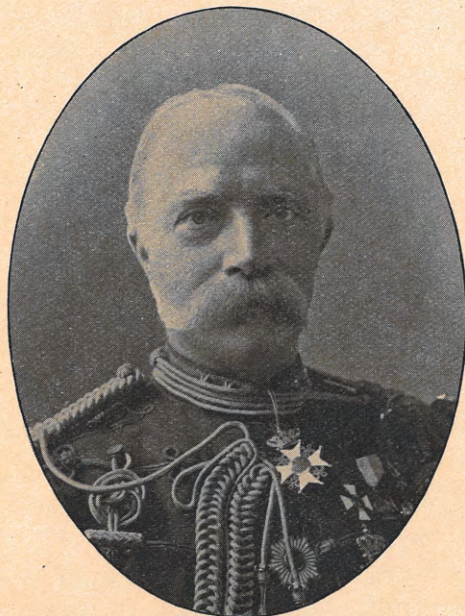
Generaal J. W. BERGANSIUS. Minister van Oorlog.