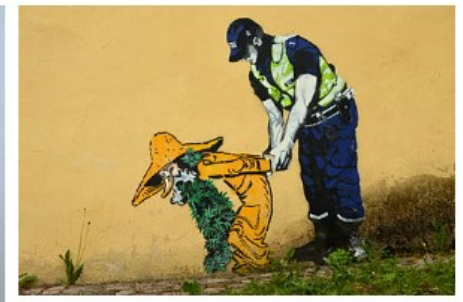
Edward von Lõngus. "Kannahabe ja nõiakütt" (2014)