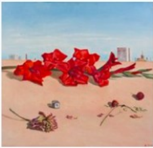
Ludmilla Siim. Punane gladiool. 1974. Tartu Kunstimuuseum