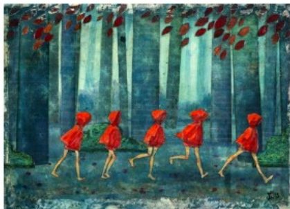
Maria Evestus, "Viis Punamütsikest I" (2014)