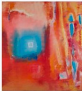
Ludmilla Siim. Punane miljöö. 2000. Kunstniku erakogu