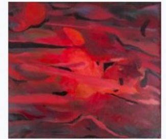
Ludmilla Siim. Suvi. 1990. Tartu Kunstimuuseum