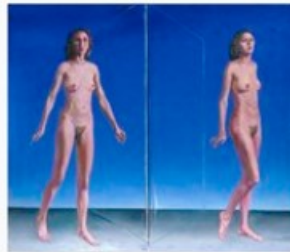
Ludmilla Siim. Peegel. 1975. Tartu Kunstimuuseum