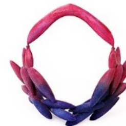
Tanel Veenre. Kaelaehe "Võidupärg" (2011)