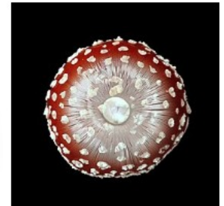
Peeter Laurits. "Taeva atlas 45" (2012)