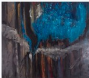
Ludmilla Siim. Kalevala. 2008. Kunstniku erakogu