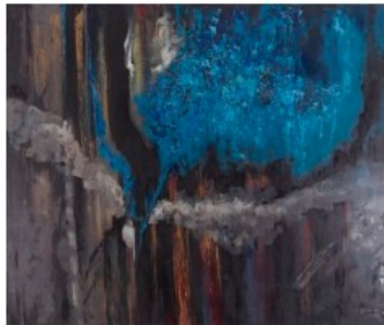
Ludmilla Siim. "Kalevala" (2008)