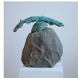
Jaan Luik, "Muutumine" (2014)