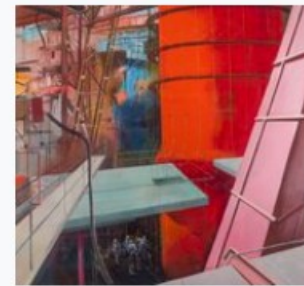
Ludmilla Siim. Metall. 1977. Tartu Kunstimuuseum