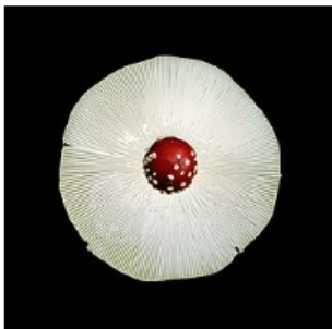
Peeter Laurits. "Taeva atlas 47" (2012)