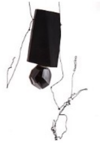
Kadri Mälk. "Amnesia" (2010)