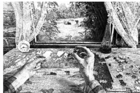
Heikki Leis, "Reaalsuse ebaadekvaatne kasutamine" (2014)