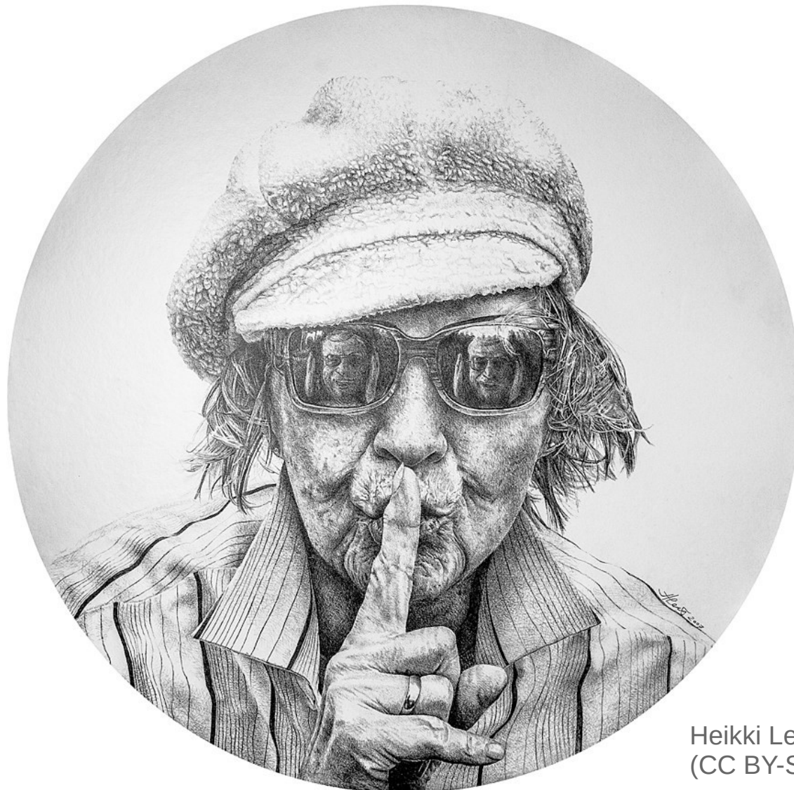
Heikki Leis. "Mother", graphite, 2007 (CC BY-SA 4.0)