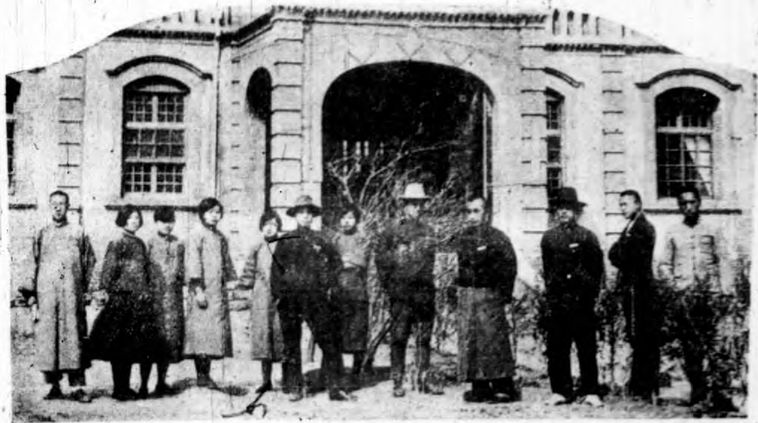
員職體全館育教衆民市城驗實立省北河