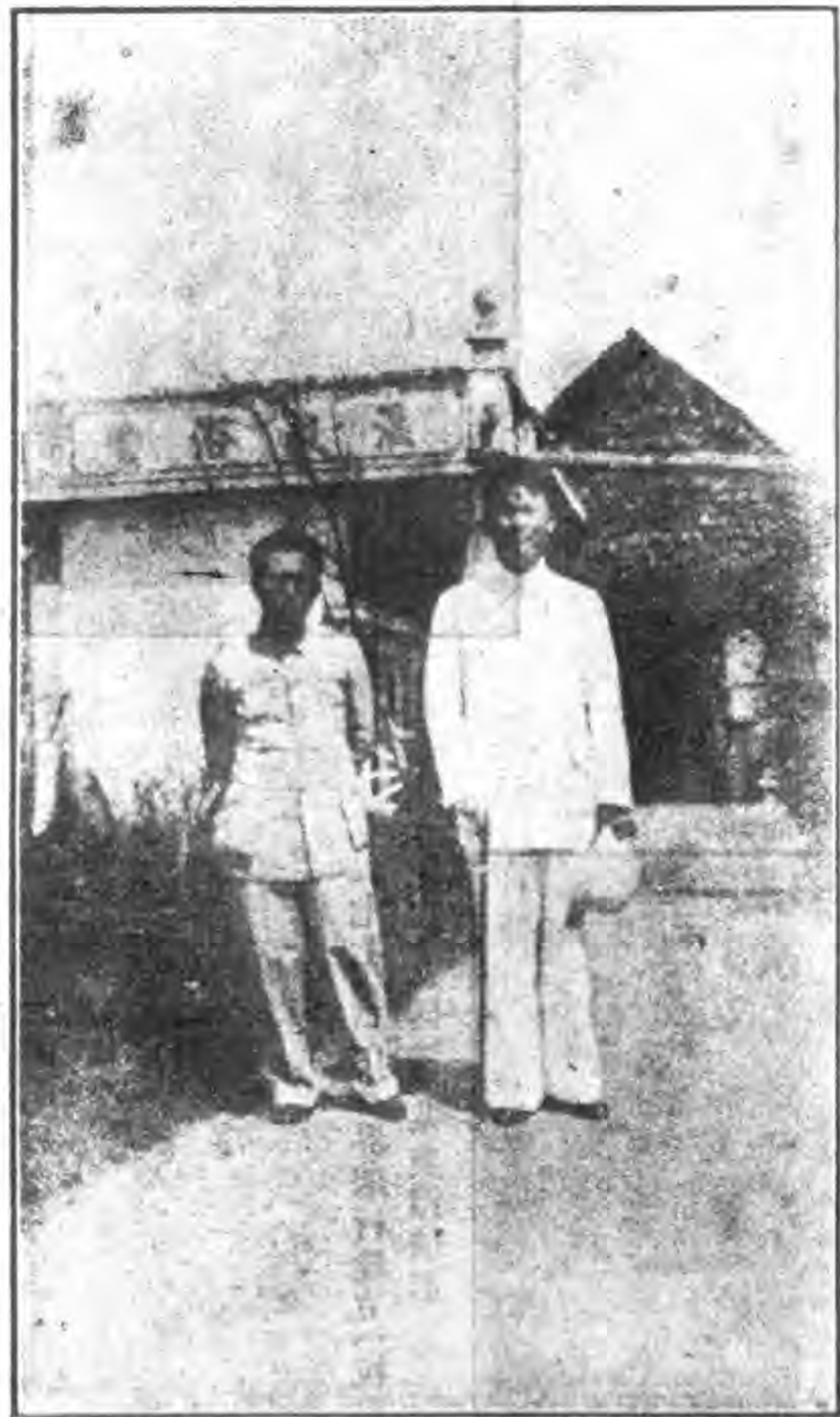
溫泉風景在台南城台南海路四十華里，