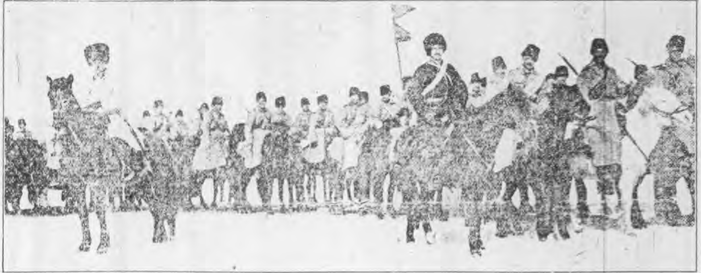
俄國貝加爾哥薩克兵隊渡冰圖