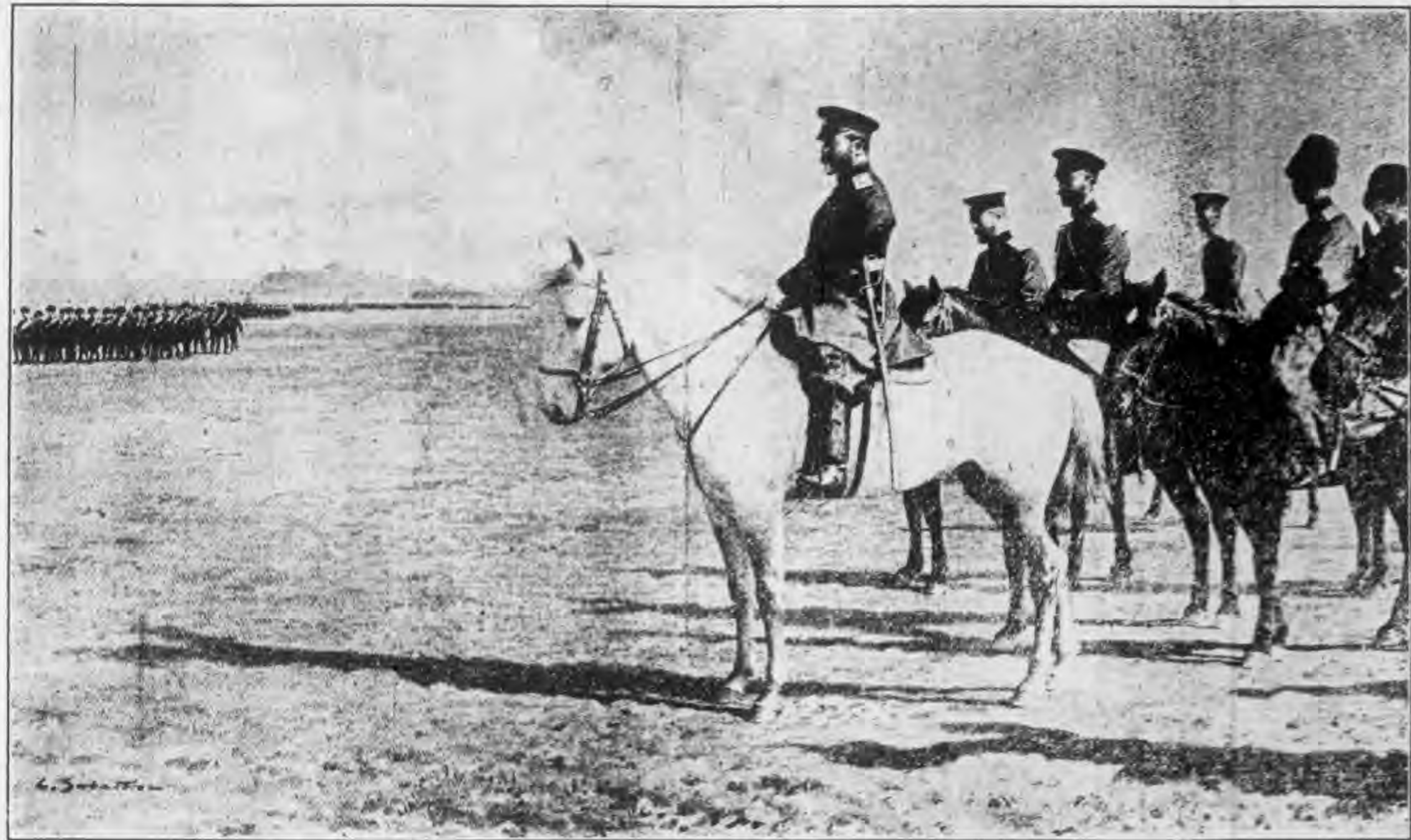
俄將苦魯巴金率衆臨陣圖