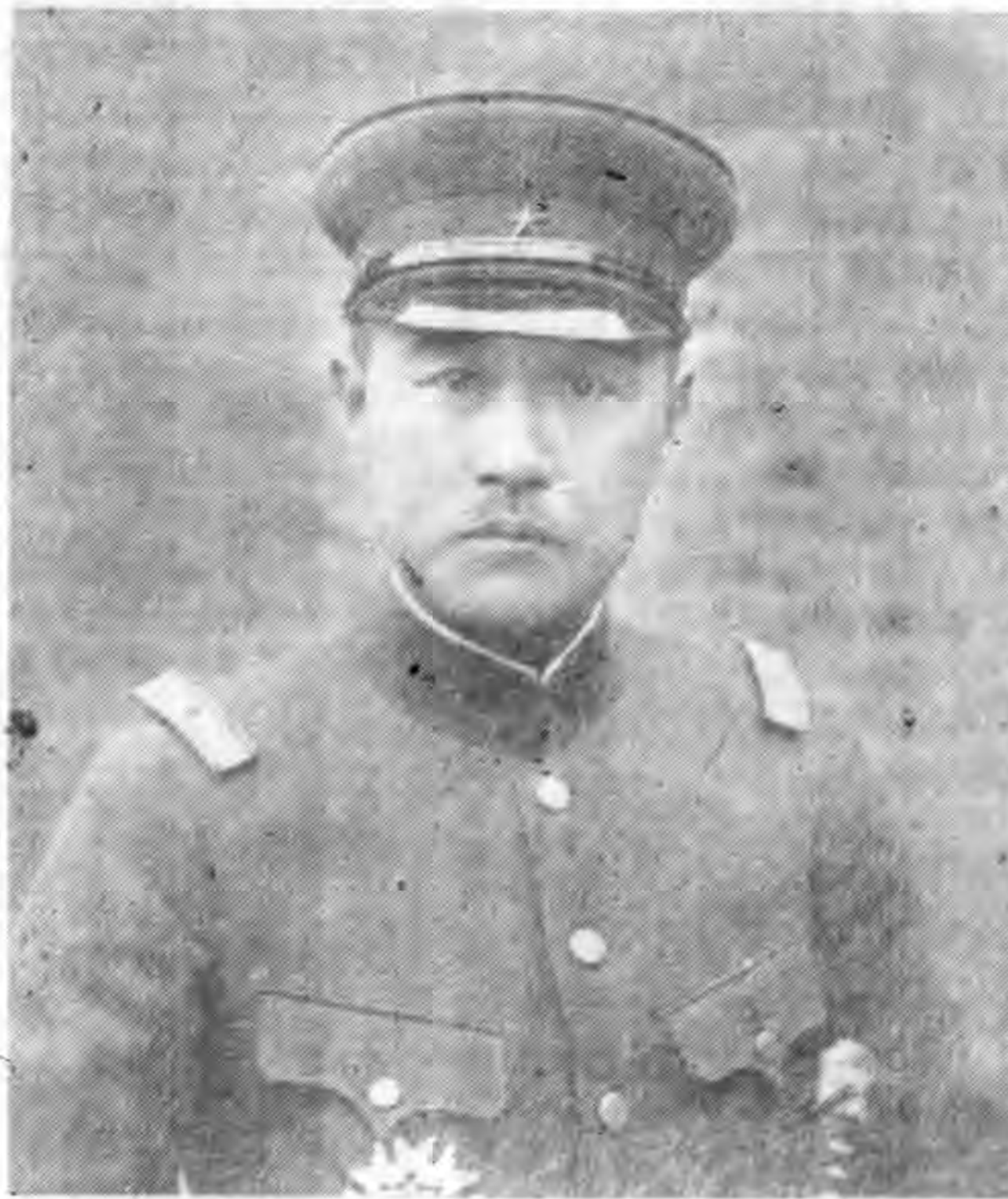
將少木小佐 閣顯高最部政軍

若狗變雲，白駒過隙，注轉未 遠，來時方遒，吾人所感於當 時者若此所望於新年者如彼， 繼以總總之責，授以艱鉅之任 抑托高厚於 九重，幸免阻於萬一，則當 益矢捐軀，勉竭愚誠，仍祈各 方不棄，示我周行，以匡不逮 而策將來，尤所禱者焉(完)