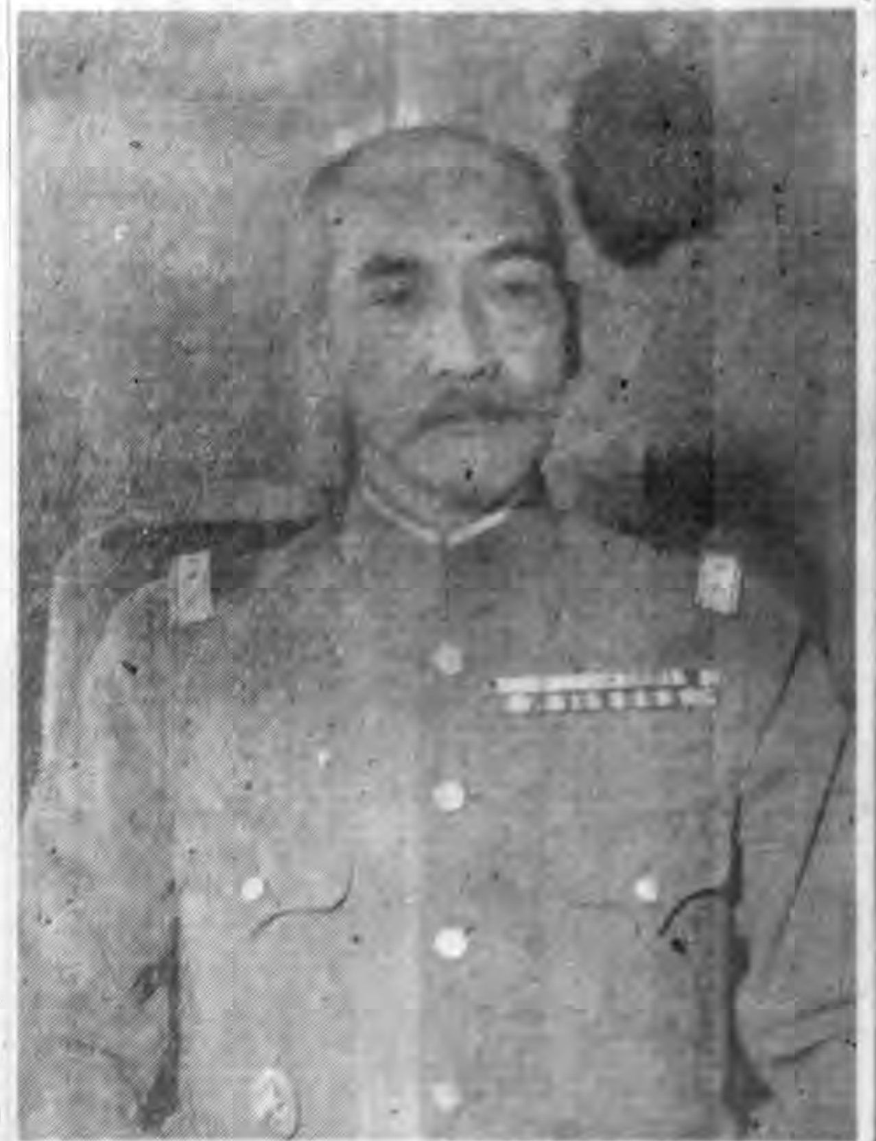
將大田植官司令軍東關