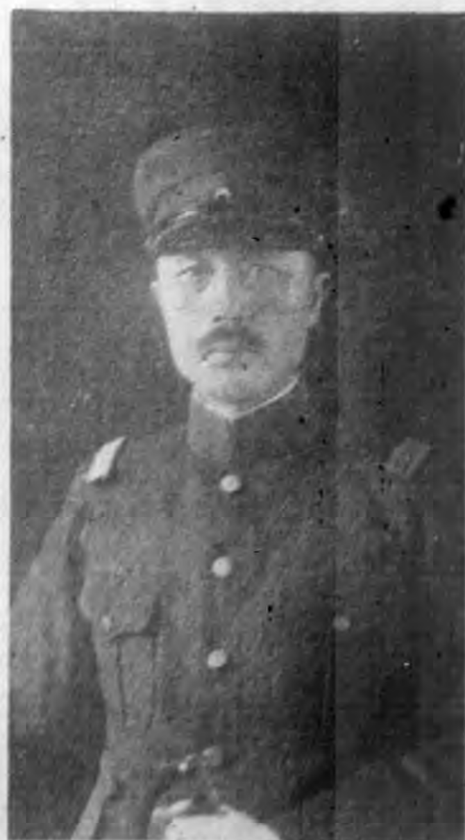
將中唐盛李長次部政軍