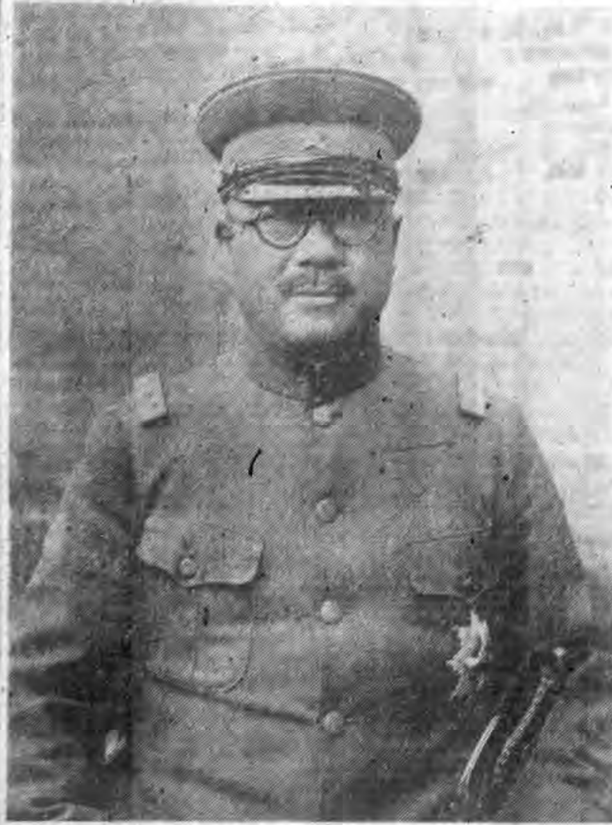
軍將山芷于臣大部政軍