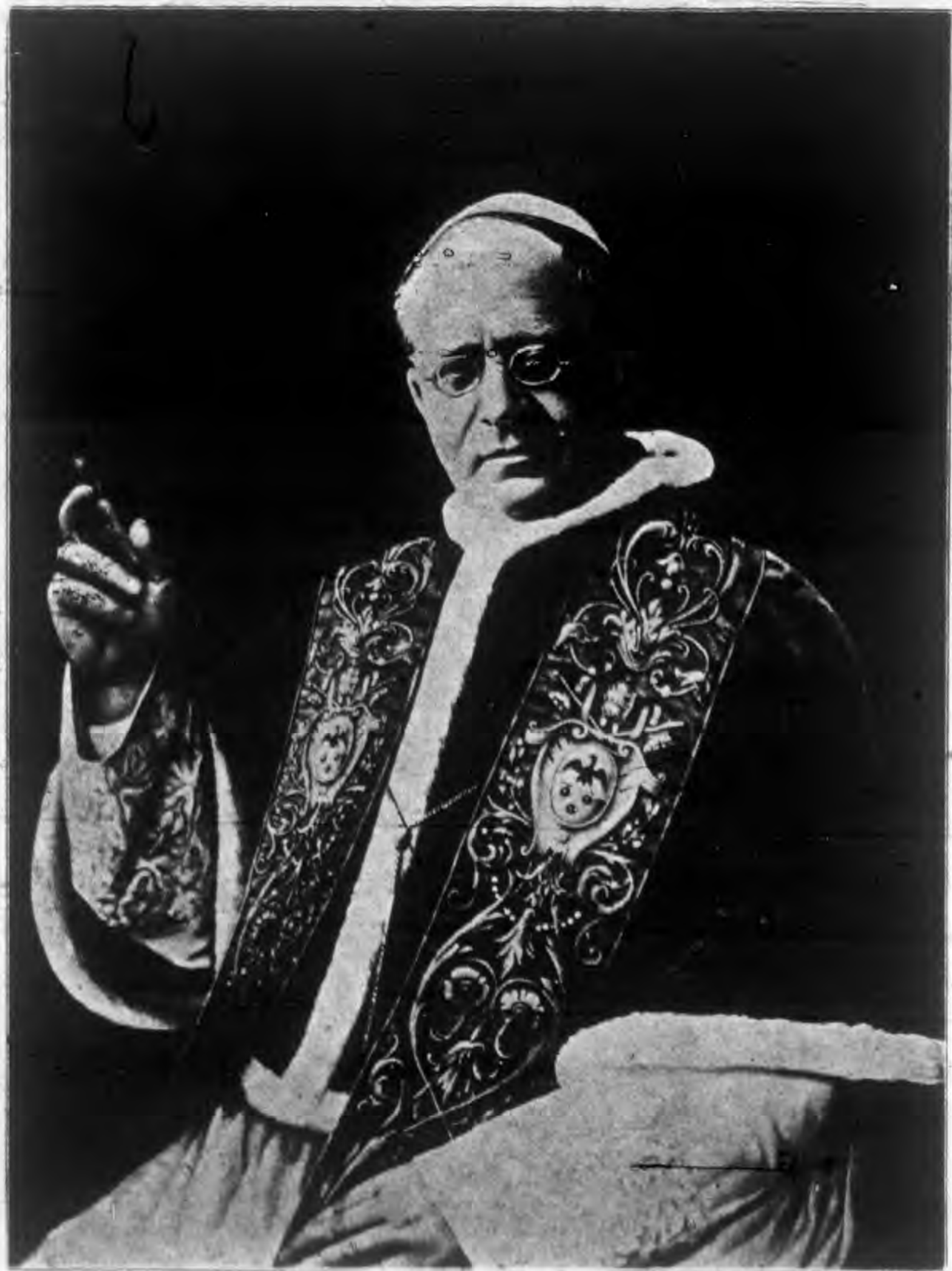
當今宗教宗庇護十一世