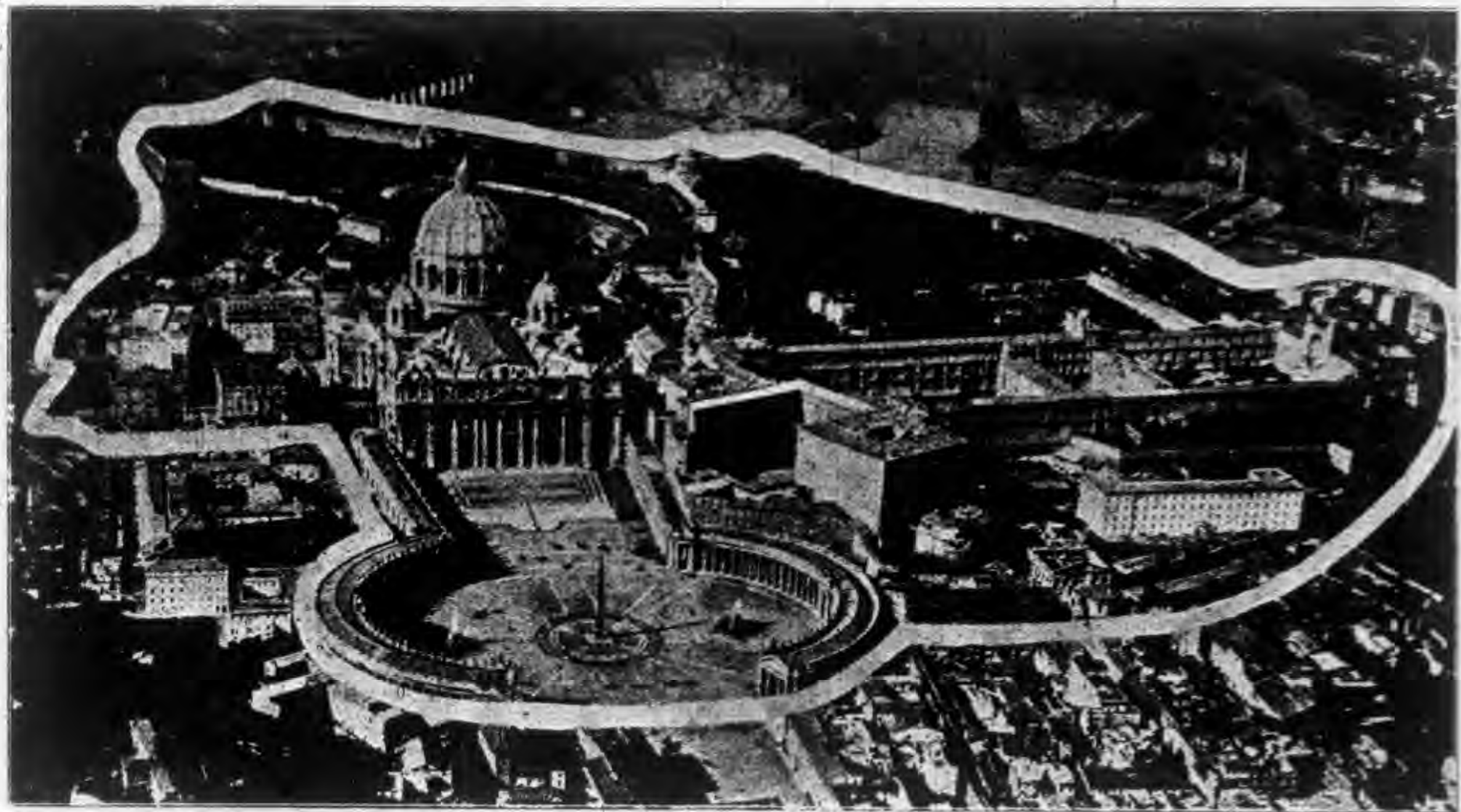
羅瑪教皇國華諦岡城