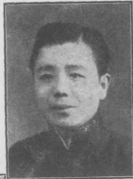
時 嘉 增