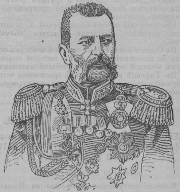
Главнокомандующій войсками гвардіи и петербургскаго военного округа Его Императорское Высочество Великій Князь Владиміръ Александровичъ.