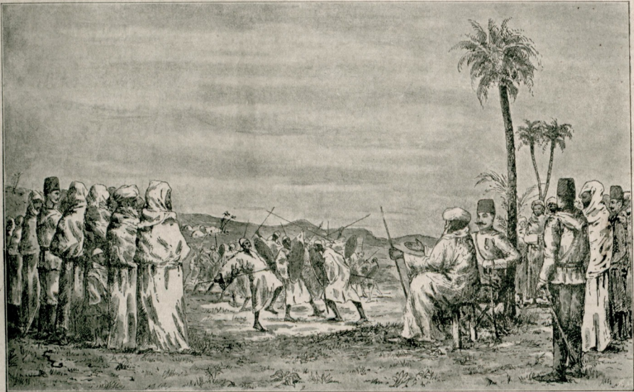
— خصوصی قروکیدن یابدیرلشدر —

[ یاوران حضرت شهریاریدن صادق المؤید بکک بحرای کبیر سیاحتی : کفردهه تبو عربانی طرفندن اجرا ایڈیلان سلاح اوبونلری ]