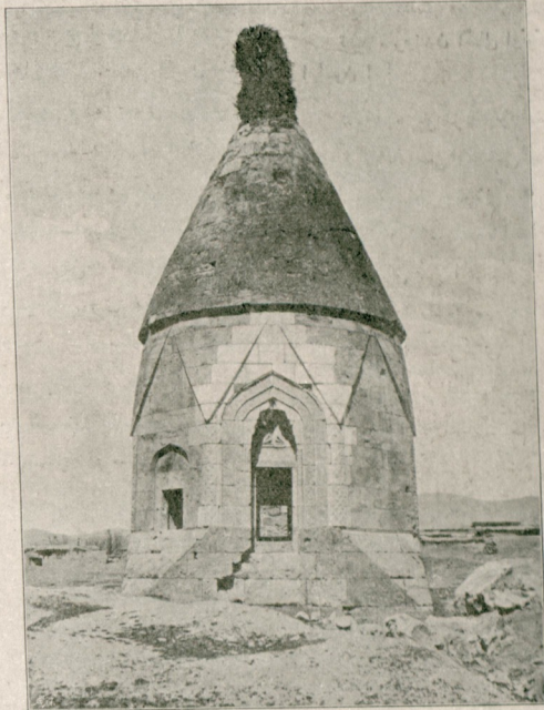
[ قبر شهرنده ملک مظفرالدینک زوجمی طرفندن انشا اولنوب خراب اولان ]

صوکره کندیکز بویه تفخزلردن ، عظمتلردن سکری قالمزسکز . هرکس معارضنه : « سنک بن علیهمده کی سوزلرک بنجه بردیل عرفاندر! دسه بیلر ، بوهرکسک سوبله بیله جکی برسوزدر ؛ فقط هرکس کندی حقتده سوبله بن سوزلری آداب مناظره دائرسته دلآله استناد استدره رک جرح ایدمز . اعتراف اتمایسکز که سز بونقطه هیهچ اهمیت ورمه مشسکز . بن نه قدر عاجز اولسه مادام که اتخاده بولوندا فکزی سوبلیوردم ، « بویه برشی غیر واقعدر ، اثبات ایسترم ! » دیملی ایدیکز . واقعا انسان هر سوزه جواب ورمز . بزده اصول مباحثه معلوم . ثروت فنون هر شیئه جواب وریورمی ؟ کهن هفته اخطار ایتدی کی ثروت فنون یالکز ادب و تربیه دائرسته سوبله بن سوزلره مقابله ایدر . سزکده اولبه یاتمقده حقکز واردر . فقط حقکزده او بولده بر تجاوز وقوع بولدیغی ادعا ایده بیلر میسکز ؟ بزم ایچون من القدم بازه کلدیکنز « اجیش بوجوش ادبا » فلان کچی وصالر سزه قارشی هیهچ برزمان روا کورولمشیدر ؟ « آه من الشعر وحالانه » ده کندیکزی بونقطهدن براز مدافعه ایدورسکز . مقاله لرکردن چوغسنگ آوروپا آتاردن ترجمه ، نقل اولدیغی ، بعضیلرک طوغرودن طوغرویه درسلردن ، مکتبلردن اخذ واقبلاس ایدلکیکی اعترافدن صوکره بونلرک هیهچ اولمازسه اوقونوب آکلشلد . یعنی ، بر مقصد خدمت ایتدیکی سوبلیور ، ونظر الاضافه باقیلرسه هانیکمک آوروپا افکارو آتاردن استفاضه ، اتحال ایتدیکنزی ، هانیکم قریحه مزندن بر فکر ابداعه مقتدر اولدیغمزی صوریورسکز . اولا ، اتحال ایدبان شیرلک اوقونوب آکلشیلیماسی ، بر مقصد خدمت ایتدی او اتحالی مدذور وحق کوسترمی ؟ بو نتیجه مأخذ تصریح اتمک ایلده استحصال اولونور . هرکس یازدیغی آکلاتمق ، بر مقصد خدمت اتمک ایچون یازار . بونده موفق اوله مازسه کندیبی ایچون برقصوردر .