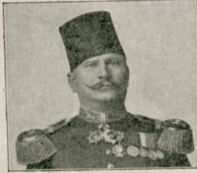
ادنه ژاندارمه قوماندانی سعادتلو مخلص باشا حضرتلری Son Excellence Mouhils Pacha.

بحث ایتمک استدیکنز نقطه بی بر آزدها آجیق سویلیلم : دور قدیمده اک زیاده شهرت آلان و مینای مدینتک اساسی وضع ایدنلر صره سنده کوریلن مصریلرک ، آتوریلرک بنیه جه ، تشکلات عضویه جه ، علائم وجهیه جه برصفت میزومی وار ایدی . انار مدینه و صنایعی می اورویا مدینت حاضره سنک اساسی اولدیغنده شبه اولمیان قدیم یونانیلرله رومالیلردهده بو قوملره مخصوص برتشکل بدن ، بوجه ، برجه ، براض ، والحاصل برتناسب مشهود ایدی . یونانستان قدیم روما دورلرندن قالب موزملرک اقدیمتدار بررکی اولان رسم وهیکلتراشلق کبی صنایع نفیسه ده حالا نمونه انسان ایدیلن هیکلرک تدقیقیله بو دورلرک کوزلرینه دایر بر فکر سلالم حاصل ایتمک ورومالیرلرک ، یونانیلرک کندیلرینه خاص تناسب بدنی علائم وجهیه سنی تامشا ایلمک ممکندر . حتی بو تدقیق و تامشا بیکلرجه سنه کچاکیکی حالده حالانسان ووقف حیرت ایدر .