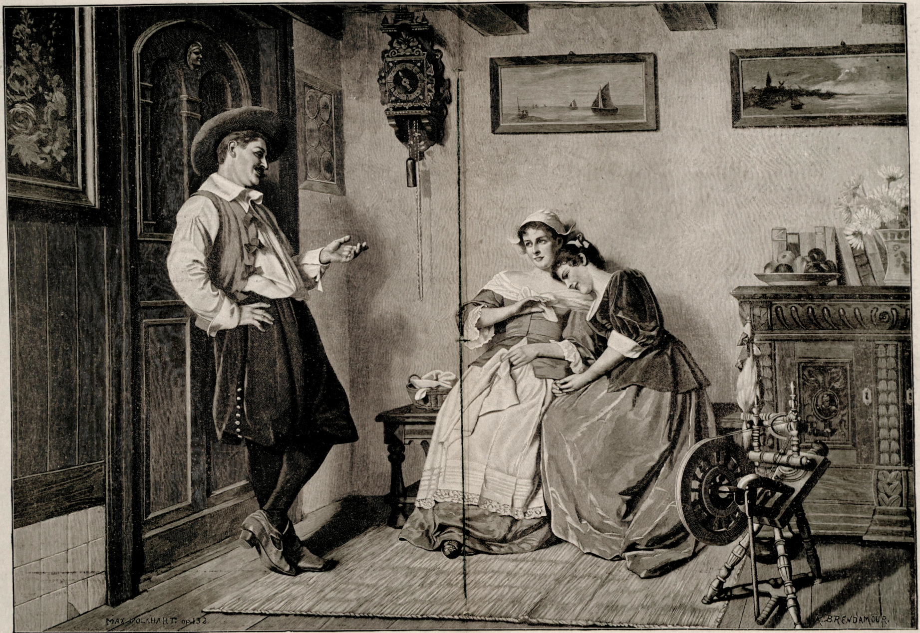
( صنایع نفیسه دن نابلو : حجاب عصمتقروشانه )