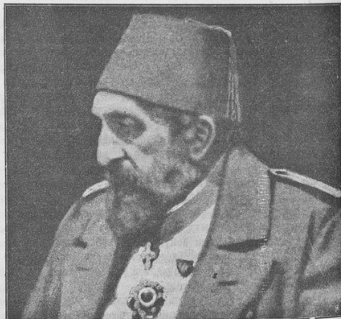
Къ событіямъ въ Турціи. Бывшій султанъ Абдуль-Гамидъ.