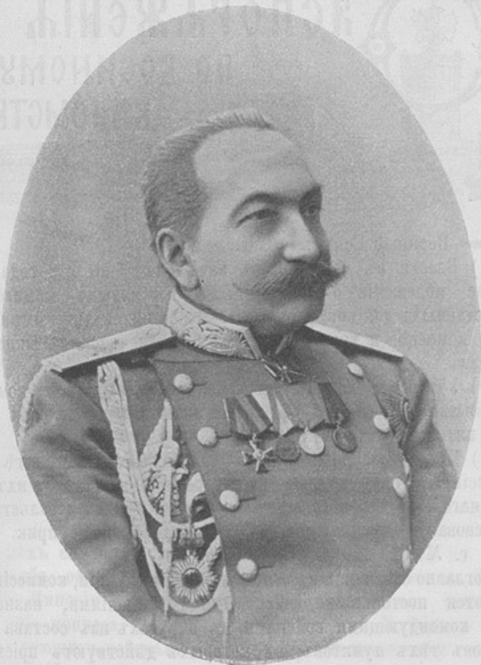
Начальникъ 30-й пѣхотной дивизіи, генералъ-лейтенантъ Михаилъ Никитичъ ИВАНОВЪ.

СОДЕРЖАНИЕ: Портретъ генералъ-лейтенанта Михаила Никитича Иванова. — С.-Петербургъ 21-го апрѣля. — Распоряженія по военному вѣдомству. — Хроника. — Что ненужно для войны—безполезно въ мирное время. Замѣтскій. — Средства пріохотить офицеровъ къ чтенію. А. К—ъ. — Штабные. И. Я. — ...Такъ тяжкій млатъ дробя стекло, куеть булатъ... К. Варяжскій. — Отжившая стрѣльба. Вѣрный капитанъ. — Обзоръ печати. — Иностранная армія. — Библиографія—Объявленія.— Высочайшіе приказы.