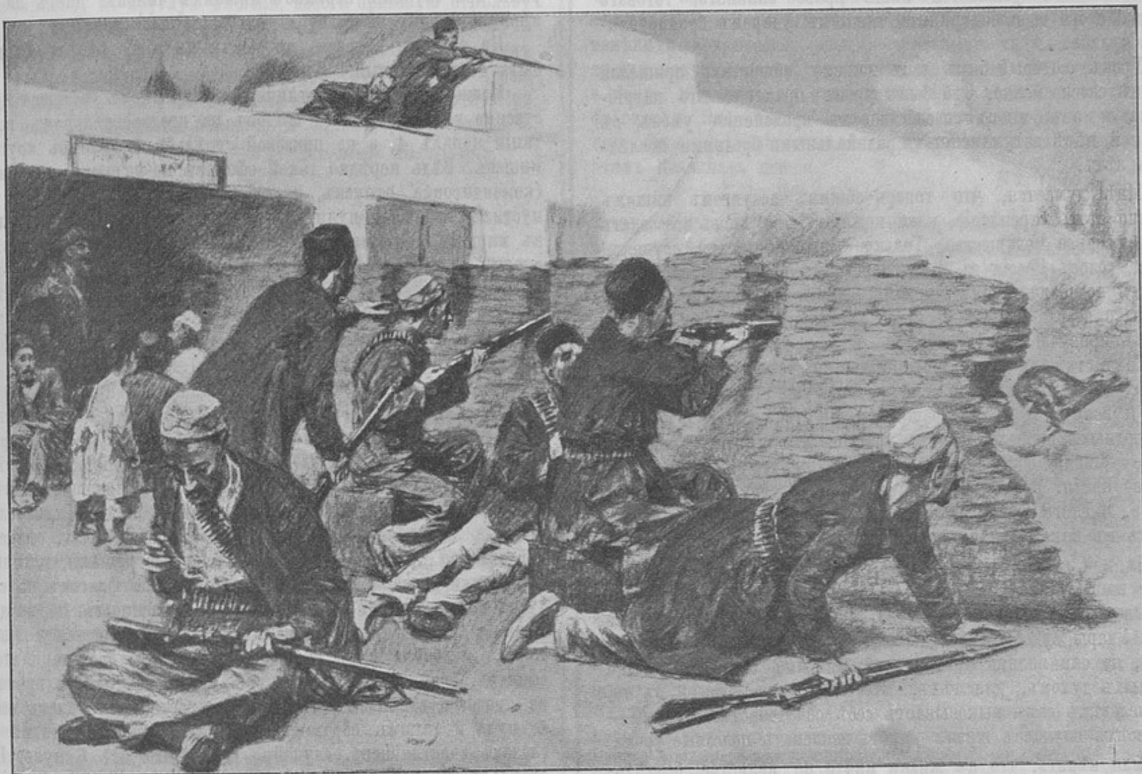
Къ событіямъ въ Персіи. Баррикады на улицахъ Тавриза.

разсчитывать на уменьшеніе числа прикомандированныхъ къ штабамъ офицеровъ. Мы предвидимъ уже протесты строевыхъ командировъ противъ высказанныхъ нами мыслей, но пока штабы существуютъ, а они конечно существовать будутъ всегда, на нашъ взглядъ вышеприведенный порядокъ комплектованія штабовъ можетъ принести двойную пользу, какъ штабамъ, такъ и самимъ войсковымъ частямъ. Про больныхъ офицеровъ мы не говоримъ, такъ какъ комплектованіе штабовъ больными офицерами, конечно, нельзя признать нормальнымъ порядкомъ—это само собой очевидно и не требуетъ особыхъ доказательствъ. Про замѣну офицеровъ въ штабахъ чиновниками мы подробно поговоримъ другой разъ, пока же скажемъ, что на нашъ взглядъ эта замѣна въ настоящее время, при существующемъ порядкѣ комплектованія военного вѣдомства чиновниками, невозможна. Намъ кажется, что строевые начальники въ интересахъ дѣла и пользы ихъ же частей не должны протестовать противъ предлагаемаго нами порядка