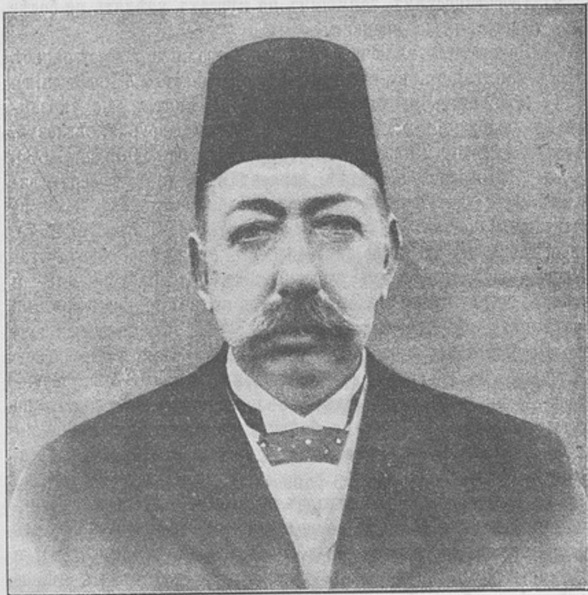
Къ событіямъ въ Турціи. Новый султанъ Магометъ V-й (Решадъ-Эффенди).

стахъ—подъемными, суточными и квартирными по прежнему положенію (пр—іе Петерб. в. о. № 79).