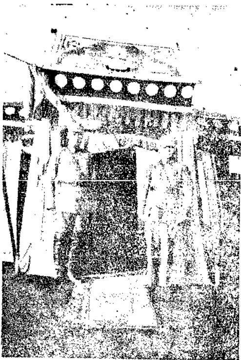
二十八年秋前第八戰區司令長官朱紹良將軍（右），代表中央赴青海主持祭海會盟後，與青海省主席步芳（左）合影。

中央大員之外，不輕易在公共場合裏出現；甚至朱谷兩人避免出席同一的集會。後來朱氏在代理新彊省主席時，曾對人說過：「我還是那一套，治理邊疆，安定中求進步。我知道大家早已覺得我這種論調太落伍，但須知目前中國還脫不了是個過渡時代，尤