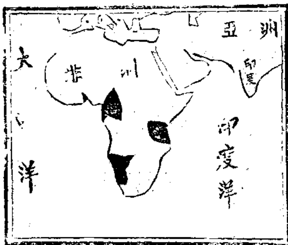
非洲舊德國殖民地

歸法蘭西；一爲東非洲南部的里昂加(Lianga)，地處拉伏馬河(Ravouna)河口，係德國於一八九五年時奪之於葡萄牙的，今依一九一九年九月二十五日協約國最高會議的決定，仍歸還於葡萄牙。(這兩地應該不在德國要求收回之內。)