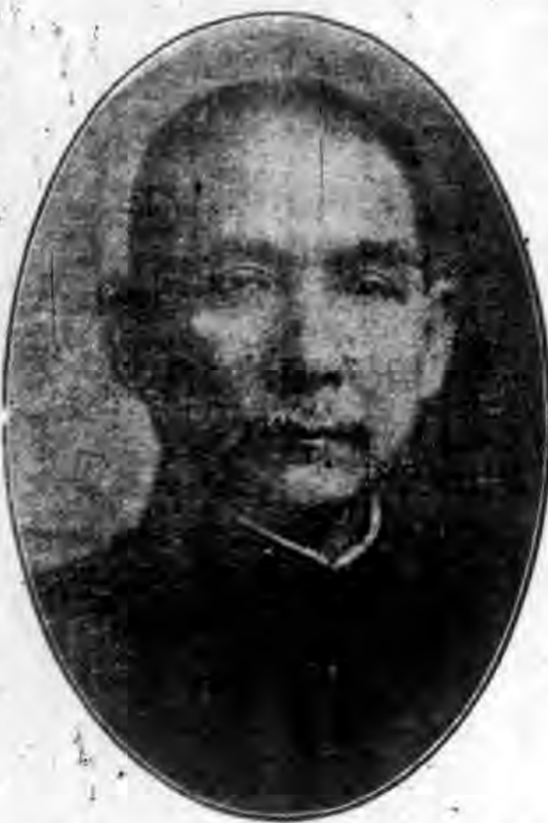
總理 遺囑 Sun Yat-sen 遺囑

余致力國民革命凡四十年其目的在求中國之自由平等積四十年之經驗深知欲達到此目的必須喚起民眾反聯合世界上以平等待我之民族共同奮鬥 現在革命尚未成功凡我同志務須依照余所著建國方略建國大綱三民主義及第一次全國代表大會宣言繼續努力以求貫徹最近主張開國民會議及廢除不平等條約尤須於最短期間促其實現是所至禱