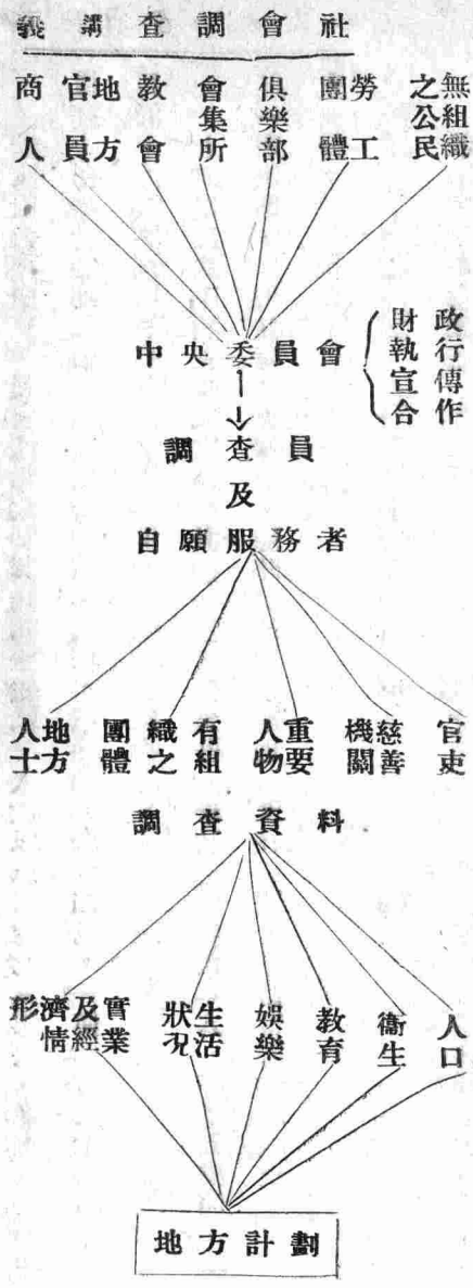
墨克林漢組織計劃表之二

依照上表，由上列各團體組成調查委員會，由調查委員會產生中央執行委員會，委員數目以五人至十五人，但不得超過十五人。從執行委員會，產生五個執行委員，負責指導工作及監察附屬機關事務進行之責任。各部設主任，專司各部工作。收集調查資料委員會下之各項材料中，如需專家指導，每項可聘請專家担任。但收集資料委員會，應視當時調查之情形而定收集資料之項目，通常須包含人口，衛生，教育，娛樂，生活或家庭狀況，實業及經濟情形等。此項組織計劃表，較為複雜，下表較為簡單，列之于次：