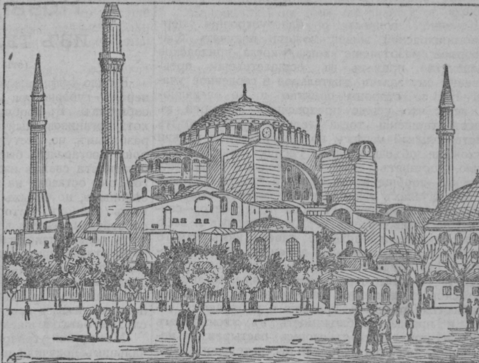
Древнѣйшій христіанскій храмъ Премудрости Божьей, построенный греческимъ императоромъ Юстиніаномъ, нынѣ превращенный турками въ мечеть, въ Константинополѣ.

Сущность означеннаго синодальнаго опредѣленія въ той его части, которая касается обновленія приходской жизни, заключается въ разрѣшеніи открытія въ приходахъ: общихъ церковно-приходскихъ собраний и церковно-приходскаго совѣта . Первыя (собранія) созываются настоятелями церквей изъ достигшихъ гражданскаго совершеннѣйшаго преданныхъ церкви прихожанъ всѣхъ званій и состояній, — съ цѣлью тѣснѣйшаго объединенія прихожанъ съ своимъ пастыремъ и между собою, для сужденія о способахъ удовлетворенія нуждъ прихода въ религиозномъ, нравственномъ, просвѣтительномъ и благотворительномъ отношеніяхъ, для возбужденія въ прихожанахъ усердія къ храмамъ Божиимъ, къ дѣламъ и вопросамъ вѣры и для содѣйствія духовенству къ успѣшному выполненію имъ лежащихъ на немъ пастырскихъ обязанностей. Для ближайшаго же осуществленія задачъ приходской жизни, Синодъ предоставляетъ церковно-приходскимъ собраніямъ избирать изъ своего состава постоянно дѣйствующій, подъ руководствомъ и предсѣдательствомъ настоятеля приходской церкви, церковно-приходскій совѣтъ, члены котораго міряне, въ числѣ 12 лицъ, могутъ быть приглашаемы причтомъ и церковнымъ старостою къ