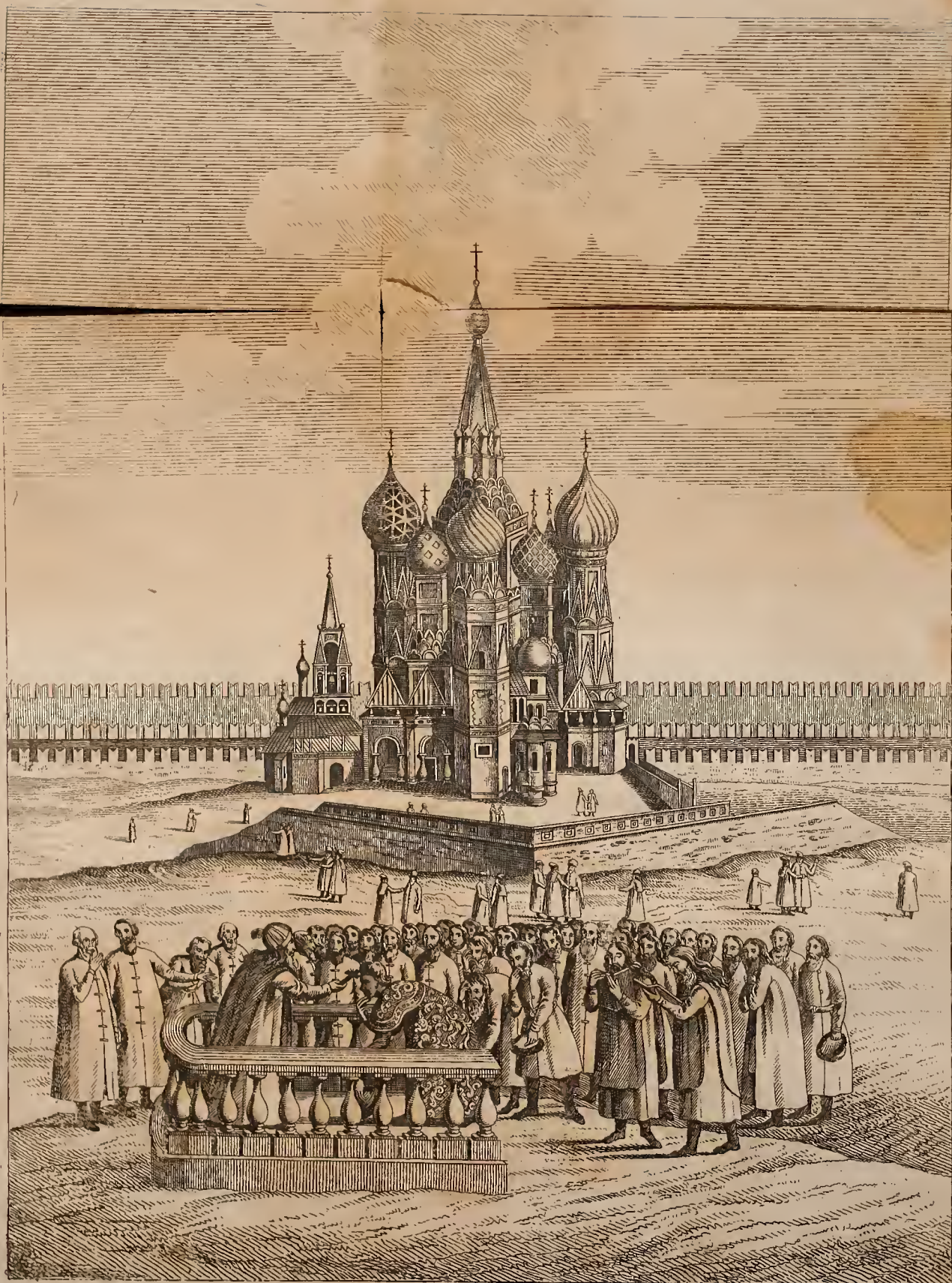
ВИДЪ СОВОРНОЙ ЦЕРКВИ ПОКРОВА ПРЕСВЯТЫЯ БОГОРОДИЦЫ при Царь Михаилъ Осодоровичъ: въ 1. 3/4 году.