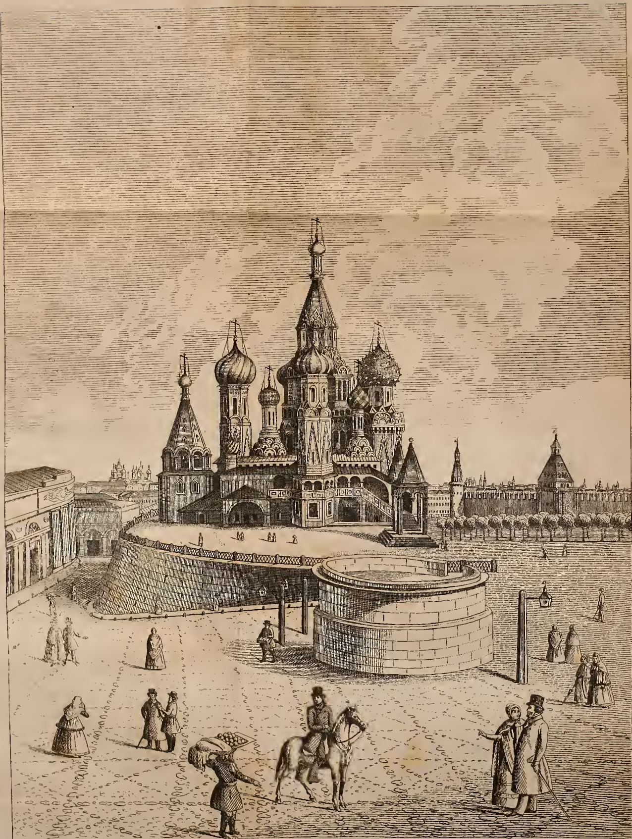
ВИДЪ ПОКРОВСКАГО И СВ: ВАСИЛІА ВЛАЖЕННАГО СОВОРА, въ Мѣсѣцѣ 19го столѣтія.