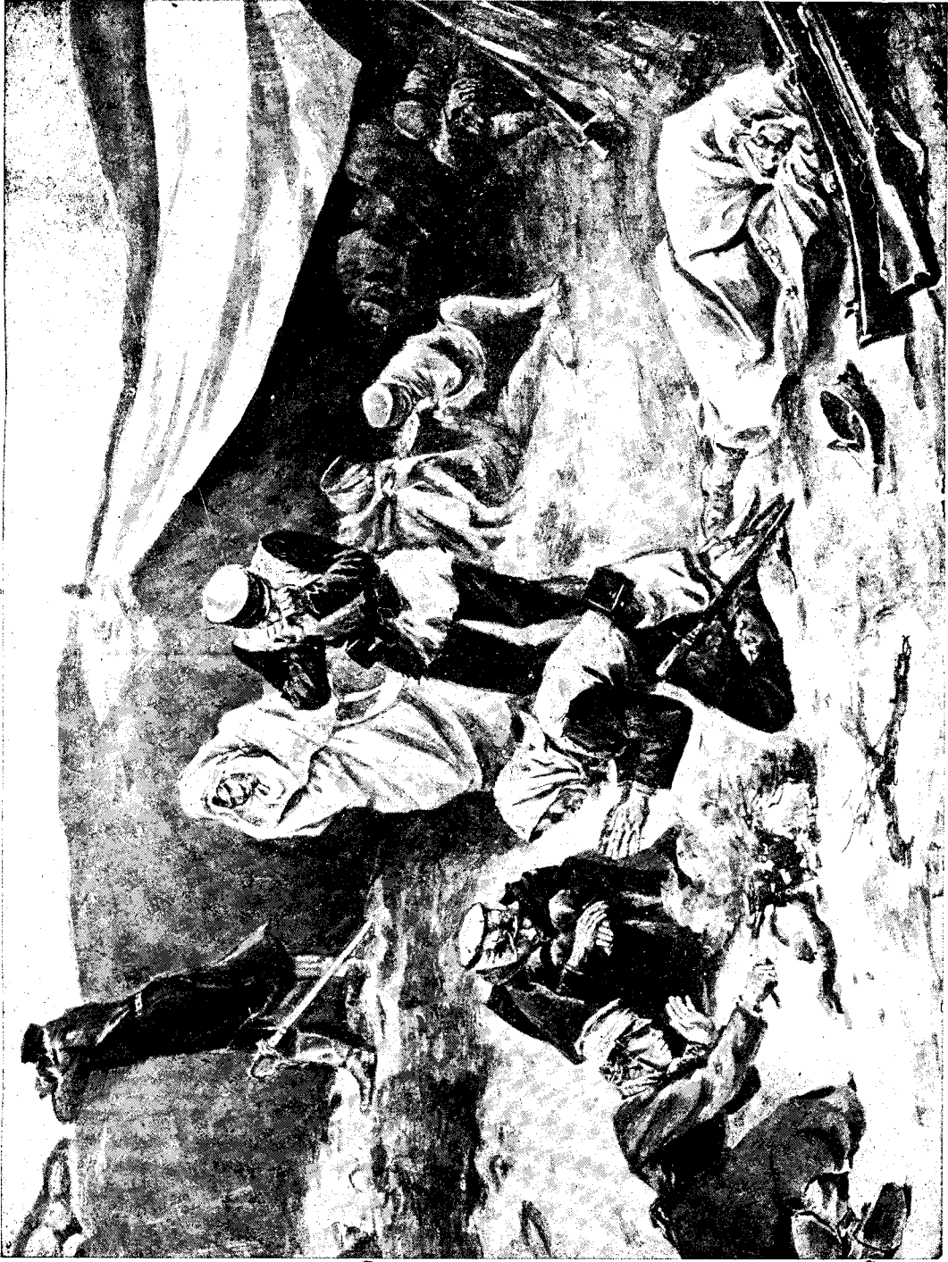
Din resbolul ruso-japonez.