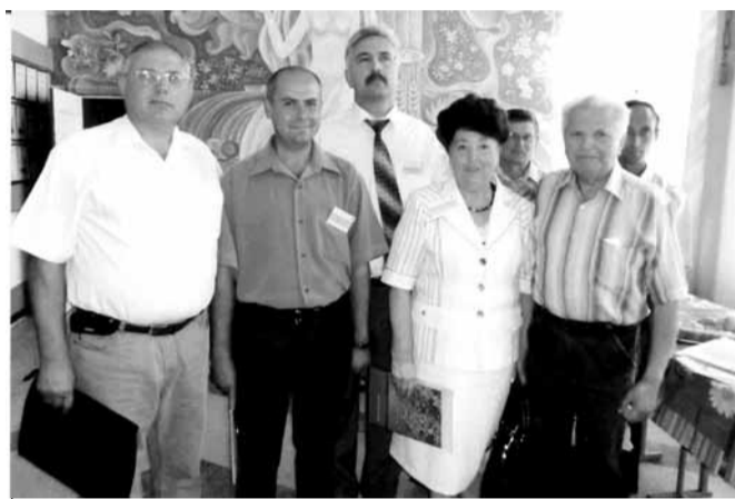
Учасники конференції з прогресивних технологій вирощування картоплі в Інституті картоплярства.

В господарстві створено відповідну матеріально-технічну базу: набір техніки для підготовки ґрунту, внесення органічних і