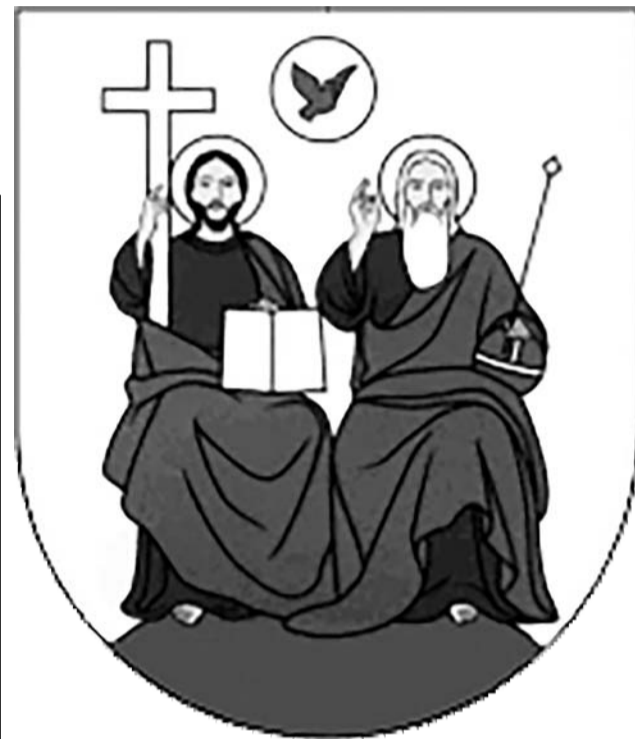
Місце знахідки — с. Пашківка, Макарівський р-н.

У 2011 р. до Музея Шереметьєвих (м. Київ) потрапила свинцева привисна печатка (молівдовул). Знайдена вона була кілька років тому під час проведення земляних робіт в Макарівському районі біля с. Пашківка.