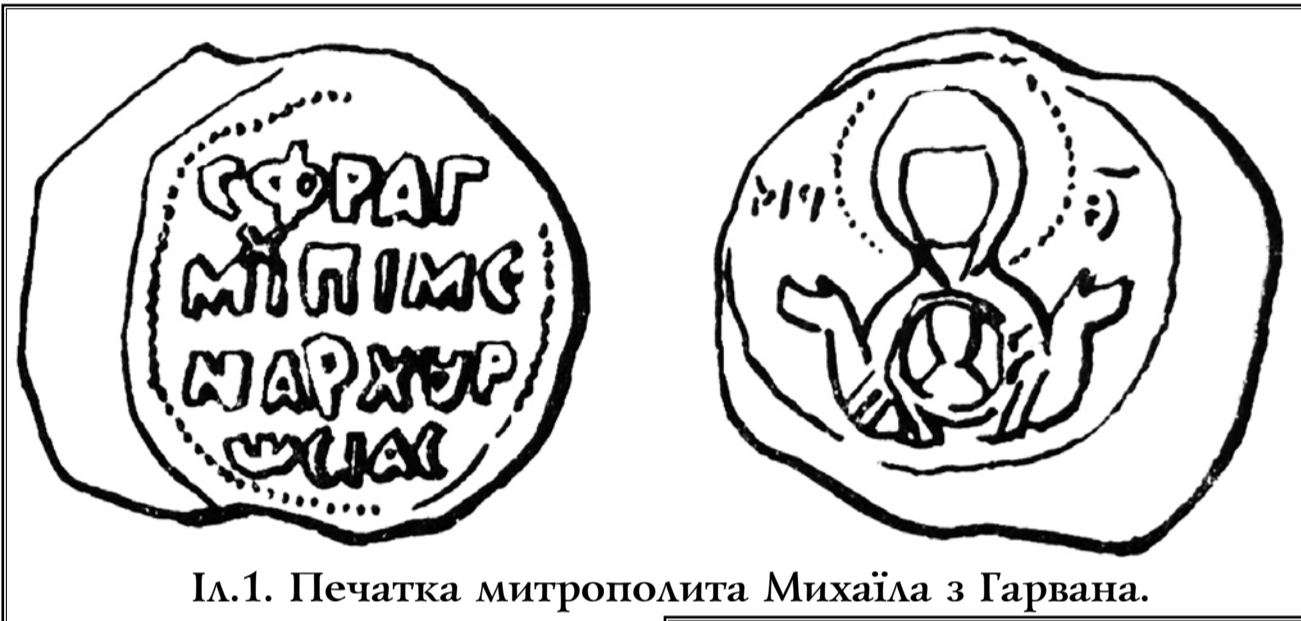
Іл. 1. Печатка митрополита Михаїла з Гарвана.

Даний сфрагіс вважався єдиним екземпляром владики Михаїла. Інтригуючою обставиною залишалось місце знахідки — Румунія. Не заперечуючи атрибуції В. Яніна, лише наголосимо, що окрім відомого з руських джерел митрополита Михаїла, існують згадки ще про двох митрополитів Михаїлів, існування яких залишається до цього часу дискусійним. Один з них — це перший київський митрополит св. Михаїл (988–991 рр.), мощі якого нині покояться в Києво-Печерській Лаврі. Традиція називати Михаїла першим головою нашої церкви закріпилась лише в XVI ст. на підставах тексту «Володимирового Устава» XII–XIII ст. Третій київський митрополит Михаїл згаданий у синодальній постанові Константинопольського патріарха від 24 березня 1171 р., про принесення присяги імператору Мануїлу I Комніну та його сину Олексію II, де серед двадцяти чотирьох митрополитів дванадцятим названо «Михаїла Руського».