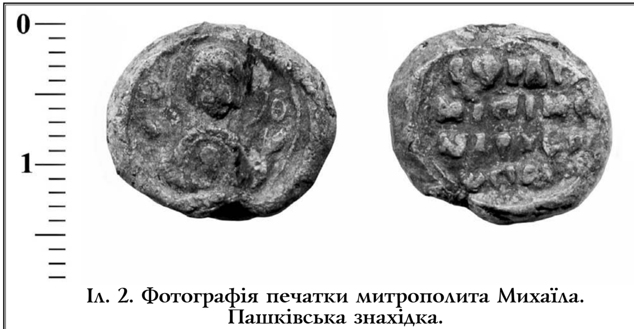
Іл. 2. Фотографія печатки митрополита Михаїла. Пашківська знахідка.

к.і.н. Олександр АЛФЬОРОВ, керівник кампанії «Пам'ять Нації».