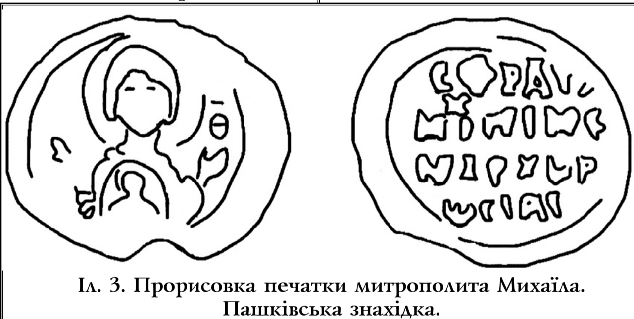
Іл. 3. Прорисовка печатки митрополита Михаїла. Пашківська знахідка.

Печатка Михаїла, архипастаря Росії] Навколо сліди лінійного обідка.