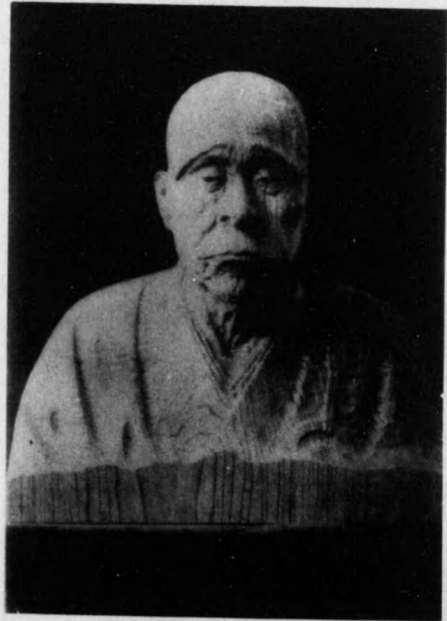
一休和尚 新海竹太郎作