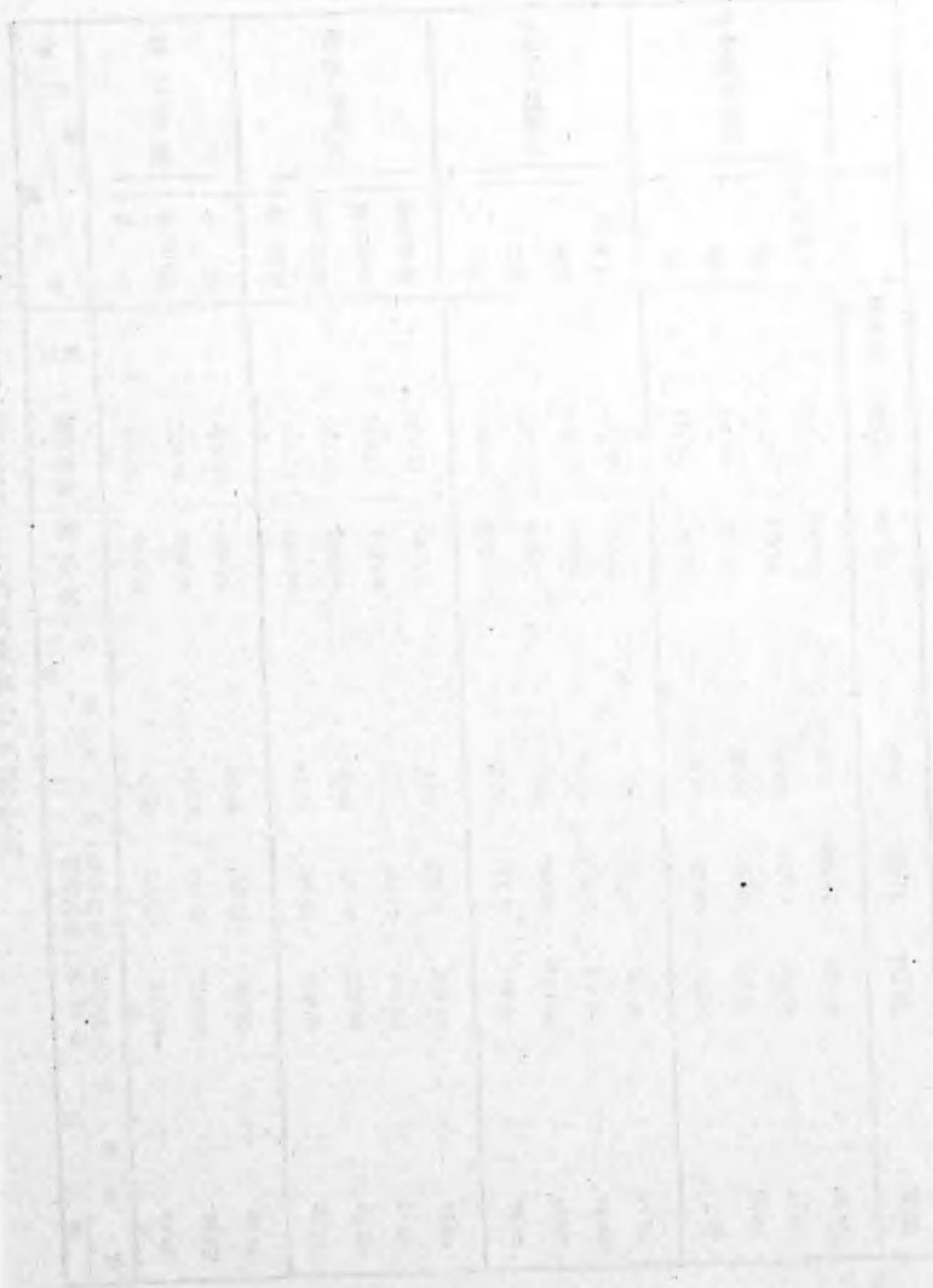
第十五表 餘利・不足農家戸數及夫等ノ餘利・不足額(現金・現物)