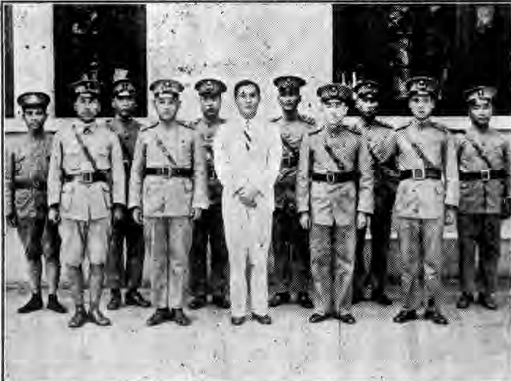
海軍警衛營黨部執監委員就職攝影