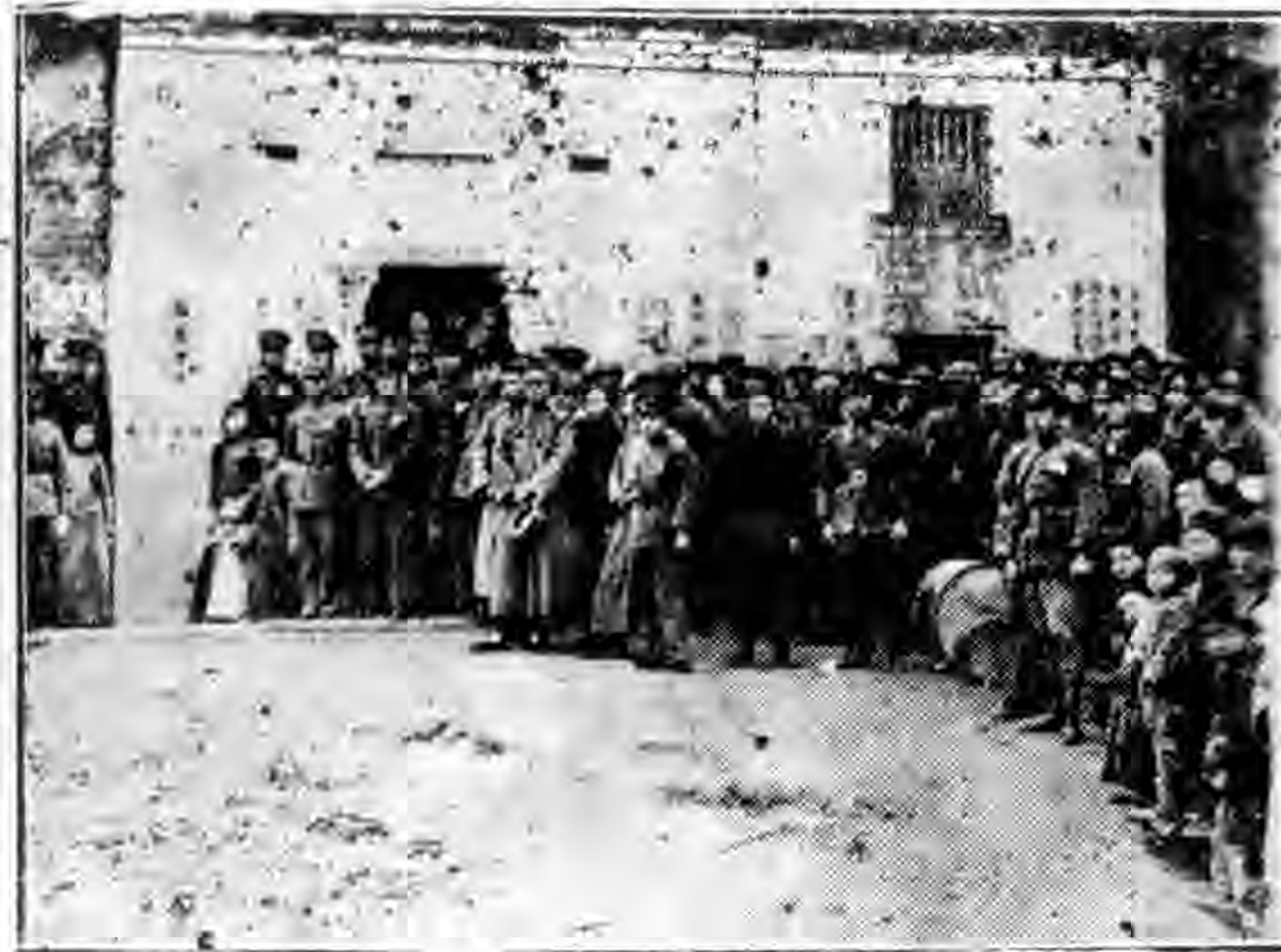
馬迴嶺各界為陸隊一旅回團長樹碑攝影

我們要拿事實做材料，才能夠定出方法。如果單拿學理來定方法是靠不住的。……在中國這種事實是甚麼呢？就是大家所受貧窮的痛苦。中國大家都是貧，並沒有大富的特殊階級。中國所謂貧富不均，不過在貧人的階級之中分出