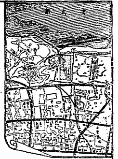
圖址四 一之分万二