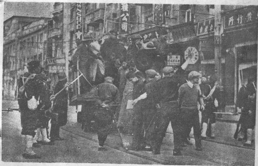
真寫變事海上八二一（圖三第）