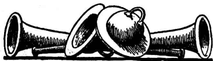
尼希米記：十二章廿七，廿八節

職任，違背你與祭司利未人所立的約。○這樣，我潔淨他們，使他們離絕一切外邦人，派定祭司和利未人的班次，使他們各盡其職。我又派百姓按定期獻柴和初熟的土產。我的神阿，求你記念我，施恩與我。